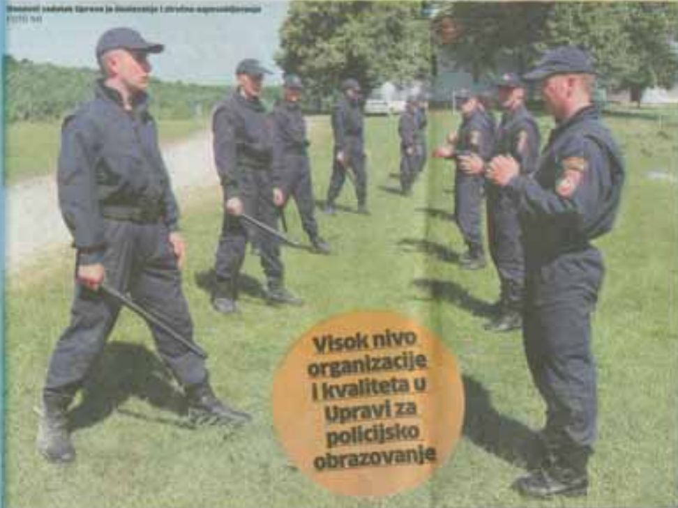
Ministar zahteva Uprava za bezbednost i obranu odgovornosti

Visok nivo organizacije i kvaliteta u Upravi za policijsko obrazovanje