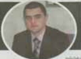
Miroslav Stokich, direktor Policijske akademije

Želimo da postanemo lider u oblasti policijskog i kriminalističkog obrazovanja ne samo u zemlji, već i u regionu, a za lakšu dostupnost nastave potrebna je dodatna i materijalna pomoć, rekao je Miroslav Stokich, direktor Uprave za policijsko obrazovanje MUP-a RS u Beogradu. Osnovni zadatak Uprave, kao osnovna organizaciona jedinica MUP-a RS, je, kaže on, osiguravanje i sprovođenje obuke i stručnog usavršavanja pripadnika Ministarstva, čiji broj se polako povećava i specijalizirani obuku i stručni usavršavanje, što je jedna od osnovnih funkcija Ministarstva.