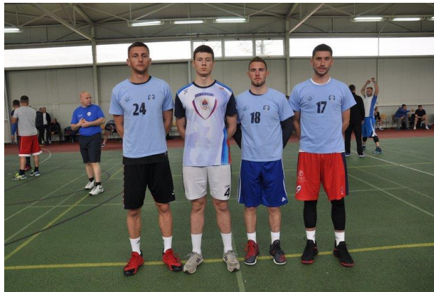
Факултет безбједносних наука