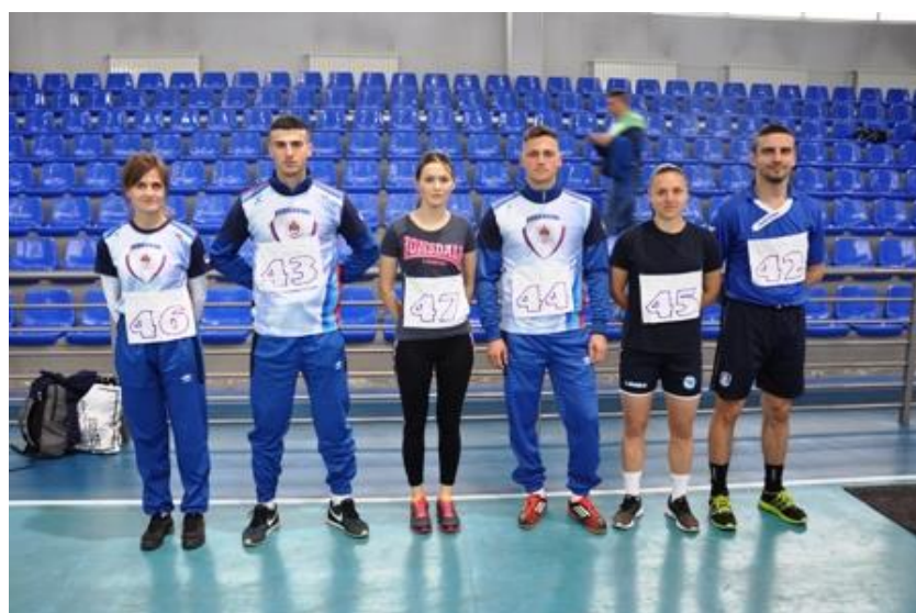
4. мјесто Екипно м/ж: ПУ ЗВОРНИК