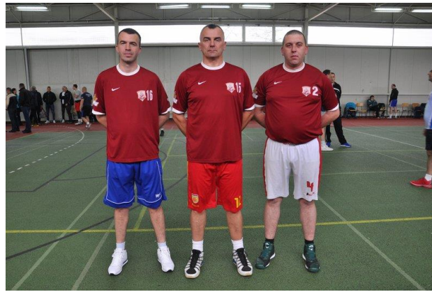
ПУ Мркоњић Град