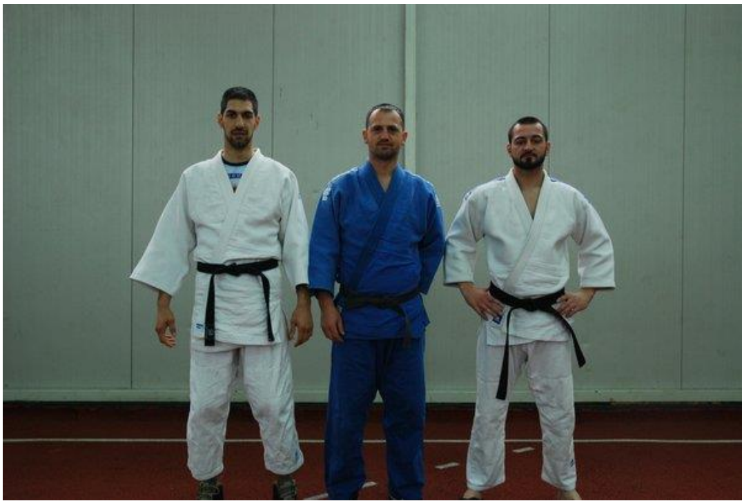
3. мјесто - ПУ ИСТОЧНО САРАЈЕВО