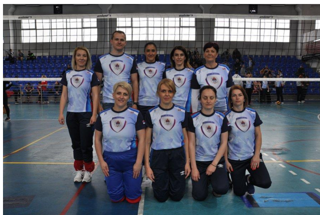
3. мјесто: ПУ Бијељина