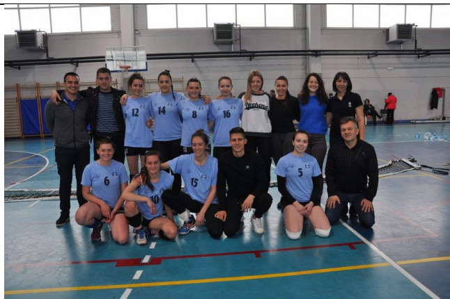
1. мјесто: Факултет безбједносних наука