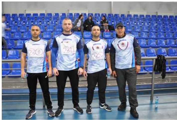
Управа за ОиТК