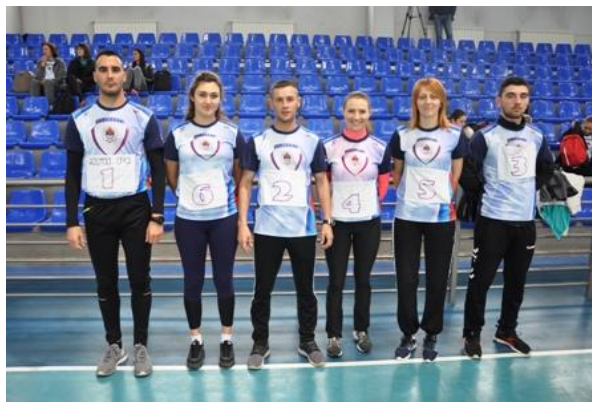
ПУ И. САРАЈЕВО