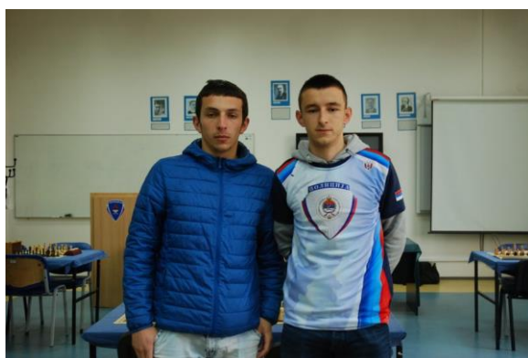
Факултет безбједносних наука