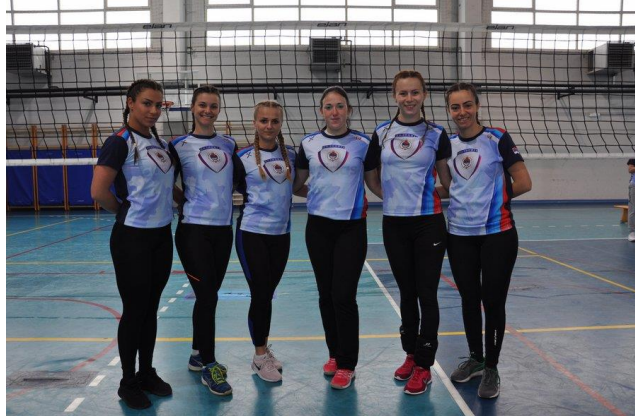
2. мјесто: Полицијска академија