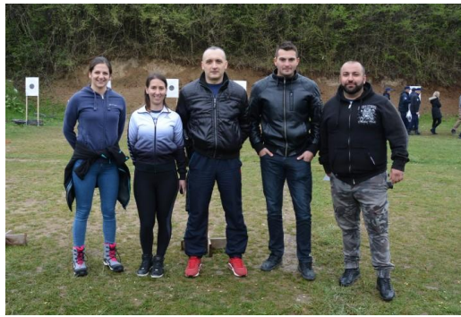
ПУ Бања Лука