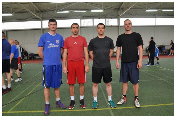
2. мјесто: Полицијска академија