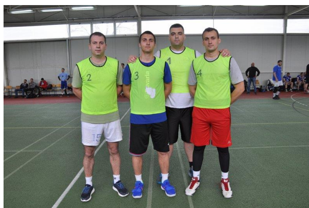
4. мјесто: ПУ Бијељина