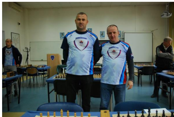
ПУ Мркоњић Град