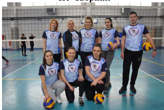
ПУ Источно Срајево