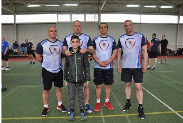
Центар за обуку