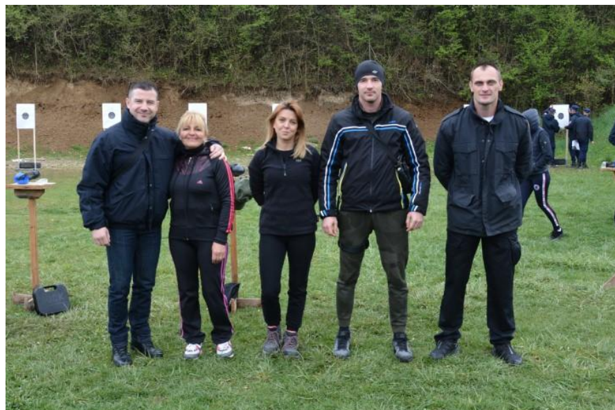
3. мјесто – Центар за обуку