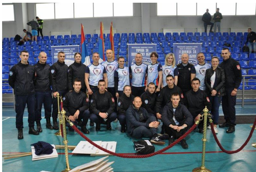
Такмичари Управе за полицијску обуку и Полицијске академије