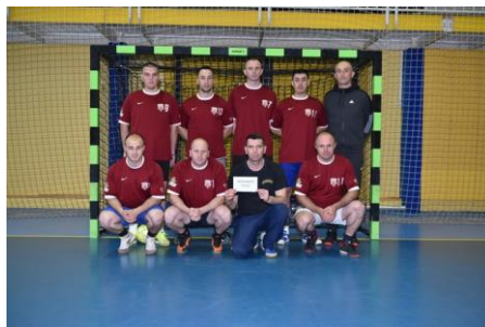
ПУ Мркоњић Град