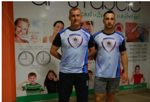
ПУ Мркоњић Град