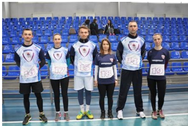
ПУ БАЊА ЛУКА