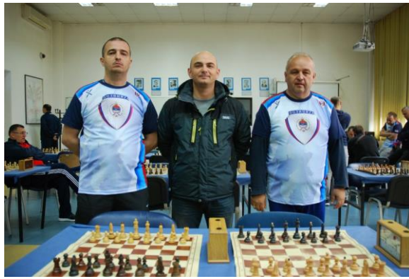
Управа за ОБЛО