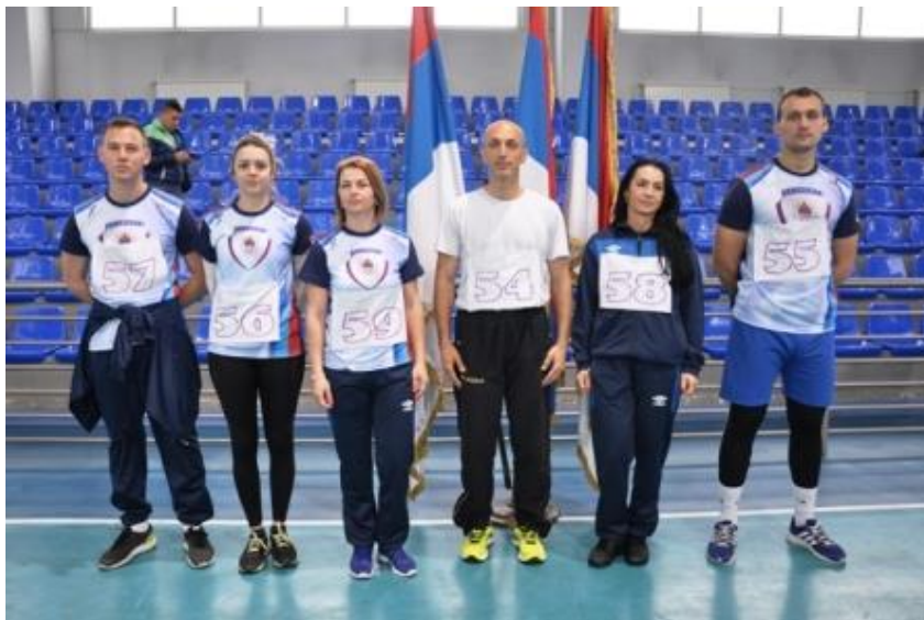
2. мјесто Екипно м/ж: ПУ БИЈЕЉИНА