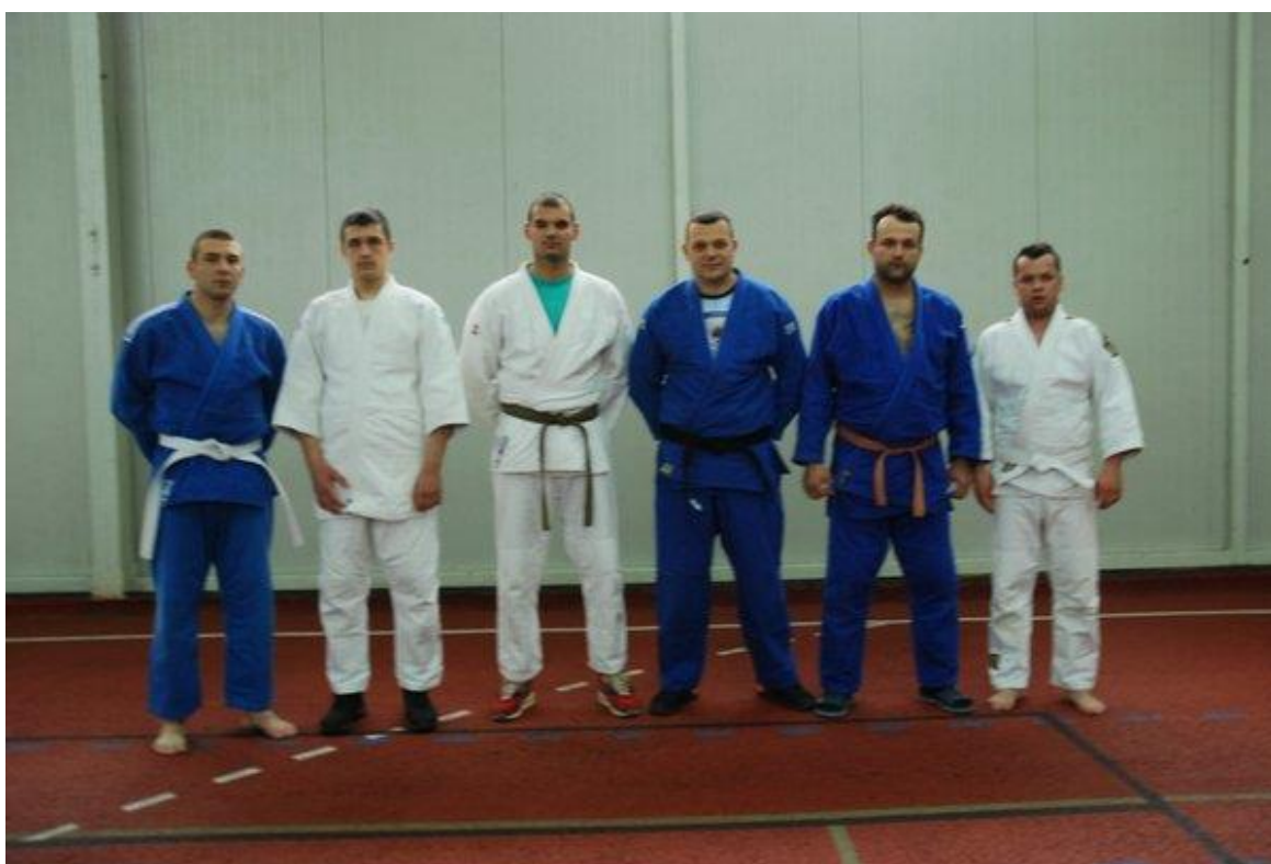
2. мјесто - ПУ БАЊА ЛУКА