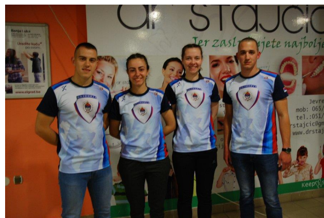
4. мјесто: Полицијска академија