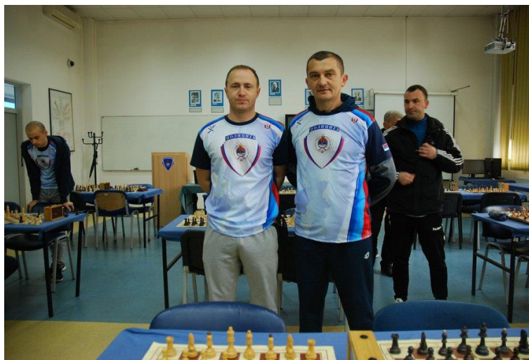
2. мјесто ПУ Добој