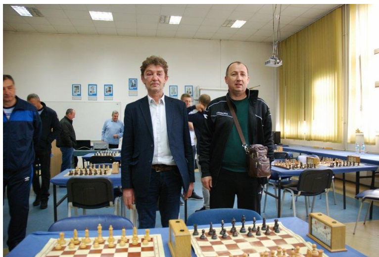
3. Управа за полицијску обуку