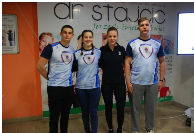
2. мјесто: ФБН