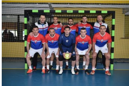
ПУ Бања Лука