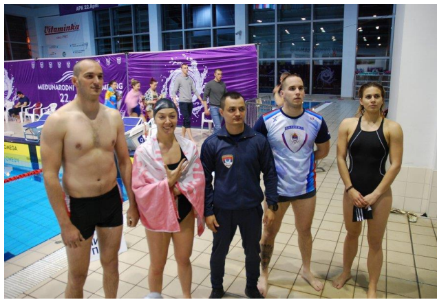
1. мјесто: САЈ