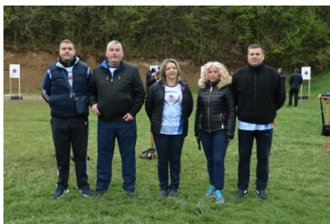
ПУ Мркоњић Град