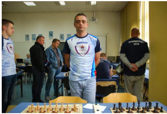
ПУ Источно Сарајево