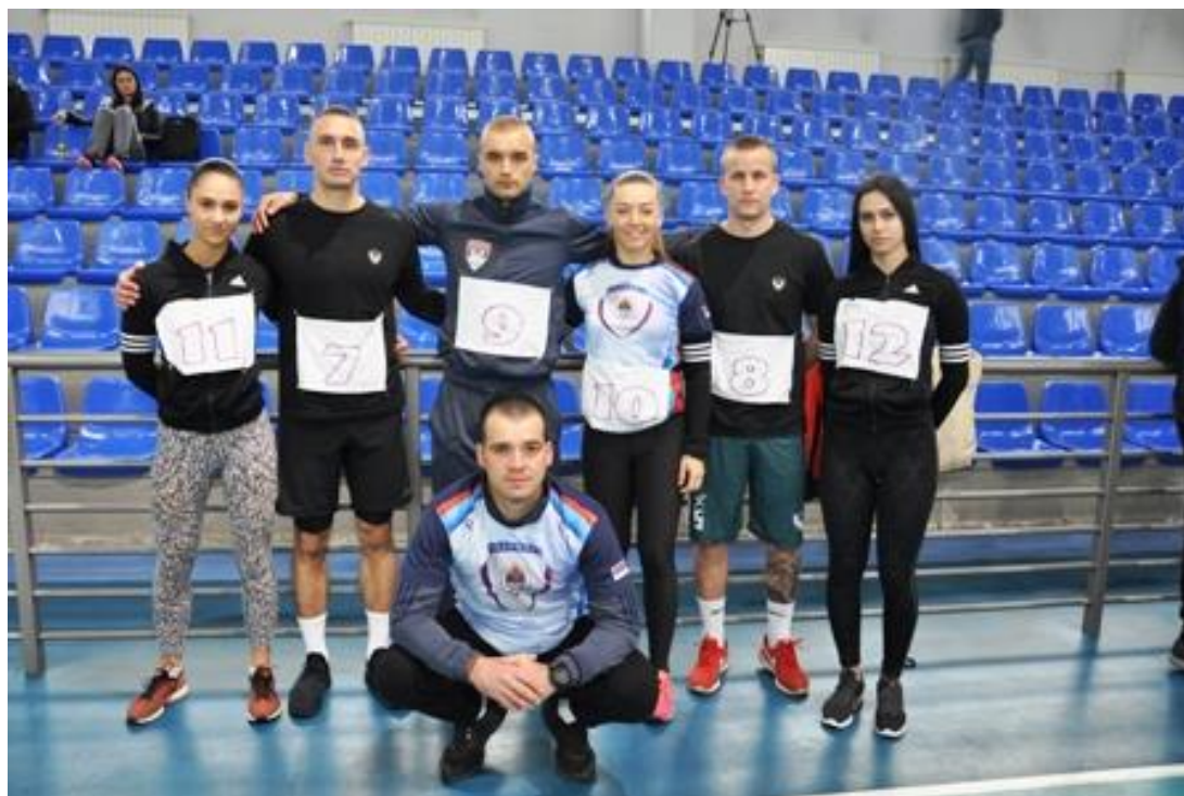
1. мјесто Екипно м/ж: САЈ