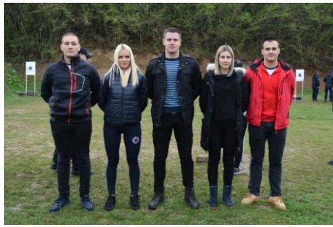
Факултет безбједносних наука