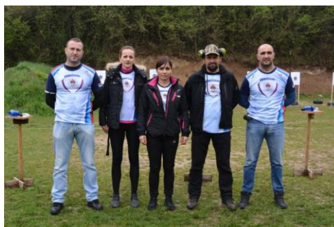
Управа за ОиТК