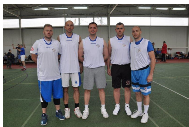
3. мјесто: ПУ Зворник