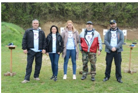
Управа криминалистичке полиције