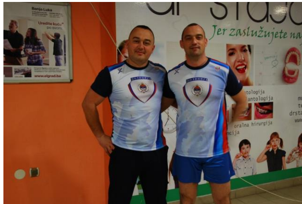
Управа за полицијску обуку