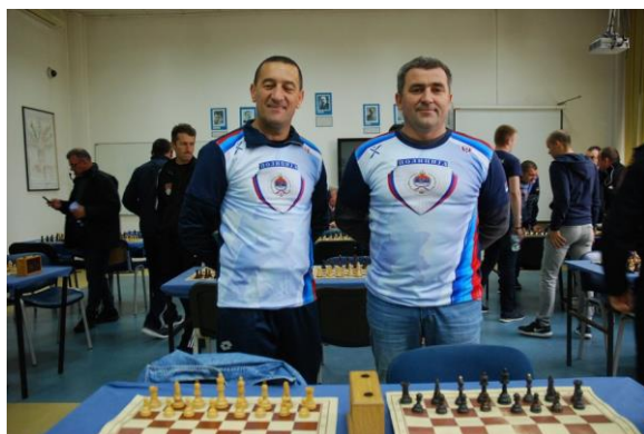
Центар за обуку