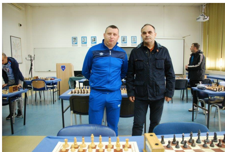
4. мјесто ПУ Зворник