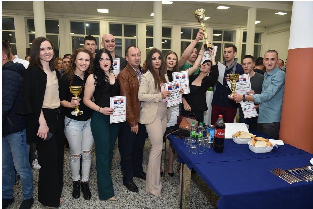
Екипа Полицијске академије – свеукупни побједник Полицијаде 2019