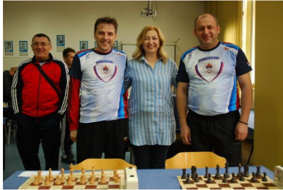
Управа за ИКТ