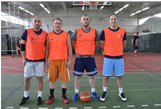
Управа за ОБЛО