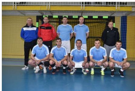
ПУ Источно Сарајево