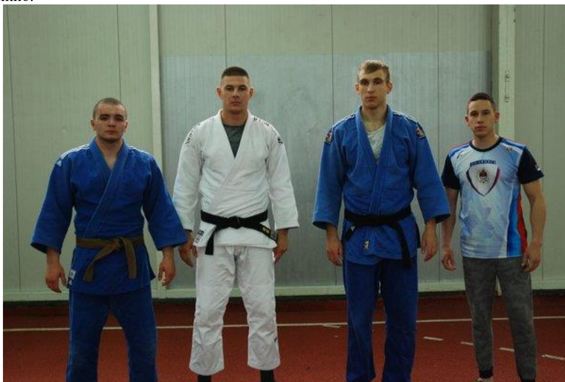
1. мјесто - ПОЛИЦИЈСКА АКАДЕМИЈА