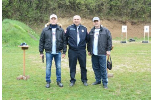
Управа за полицијску подршку