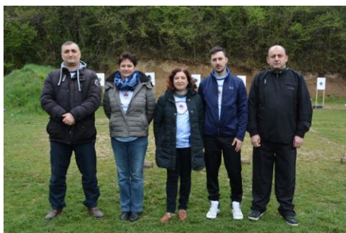
Управа за ИКТ