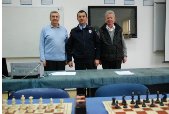
Судије и координатор за дисциплину шах