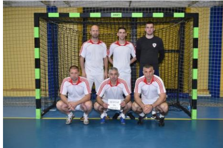
Центар за обуку