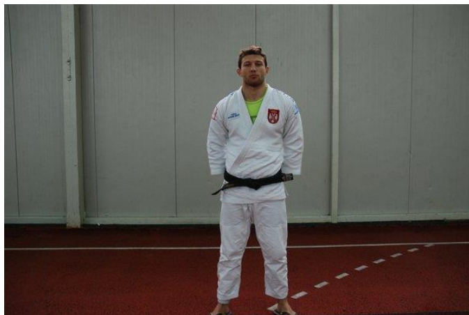
ЦЕНТАР ЗА ОБУКУ