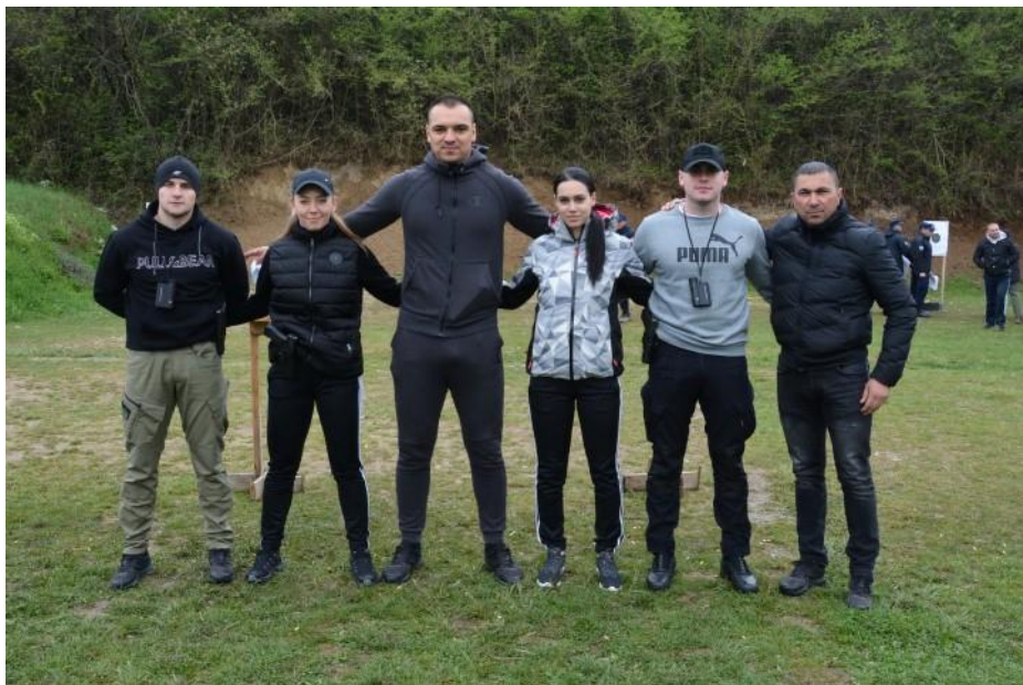
1. мјесто – САЈ