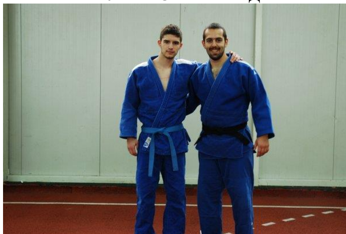
ФАКУЛТЕТ БЕЗБЈЕДНОСНИХ НАУКА