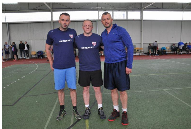
1. мјесто: ПУ Бања Лука