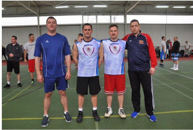
ПУ Источно Сарајево