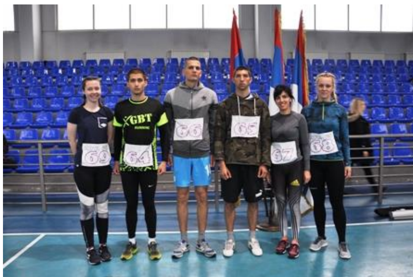
3. мјесто Екипно м/ж: ПА