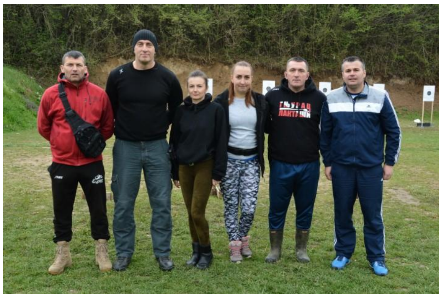
4. мјесто – Управа за ОБЛО