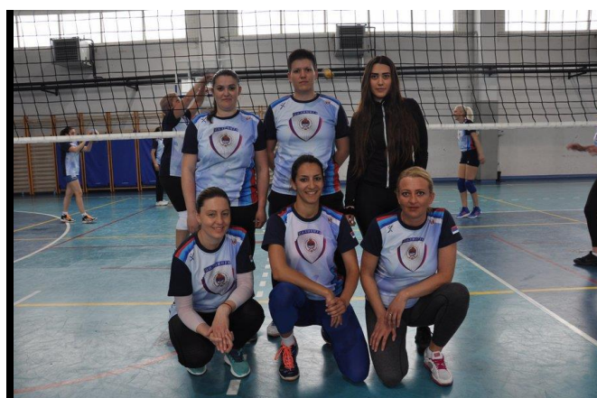
Управа за ОБЛО