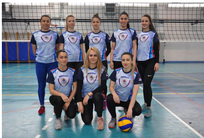
ПУ Бања Лука