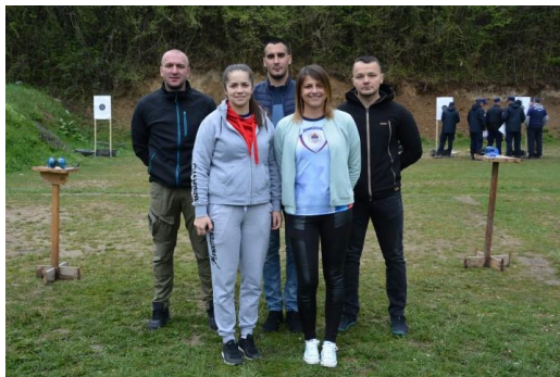
ПУ Источно Сарајево