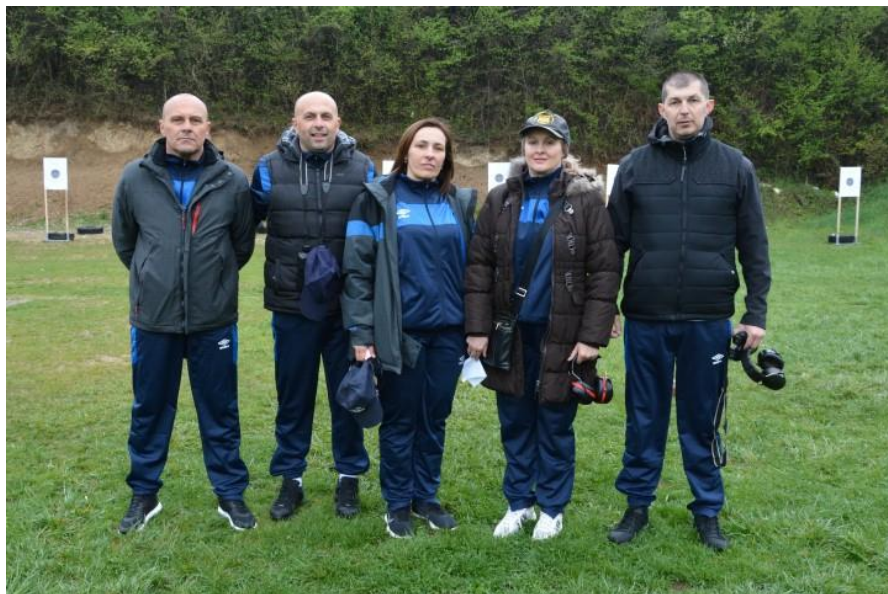
2. мјесто – ПУ Бијељина