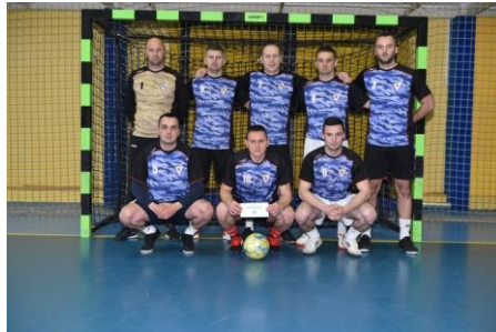
Управа за организовани и тешки криминал