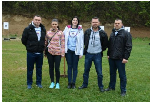
Управа за борбу против тероризма и екстремизма