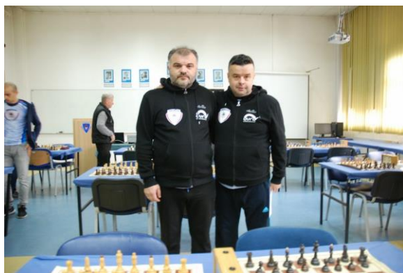
Управа за борбу против тероризма и екстремизма