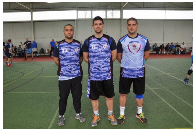
Управа за ОиТК