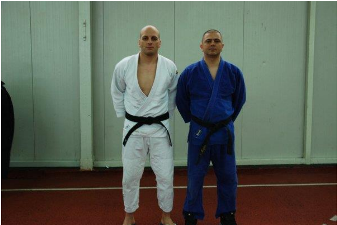
4. мјесто - УПРАВА ЗА ПОЛИЦИЈСКУ ОБУКУ