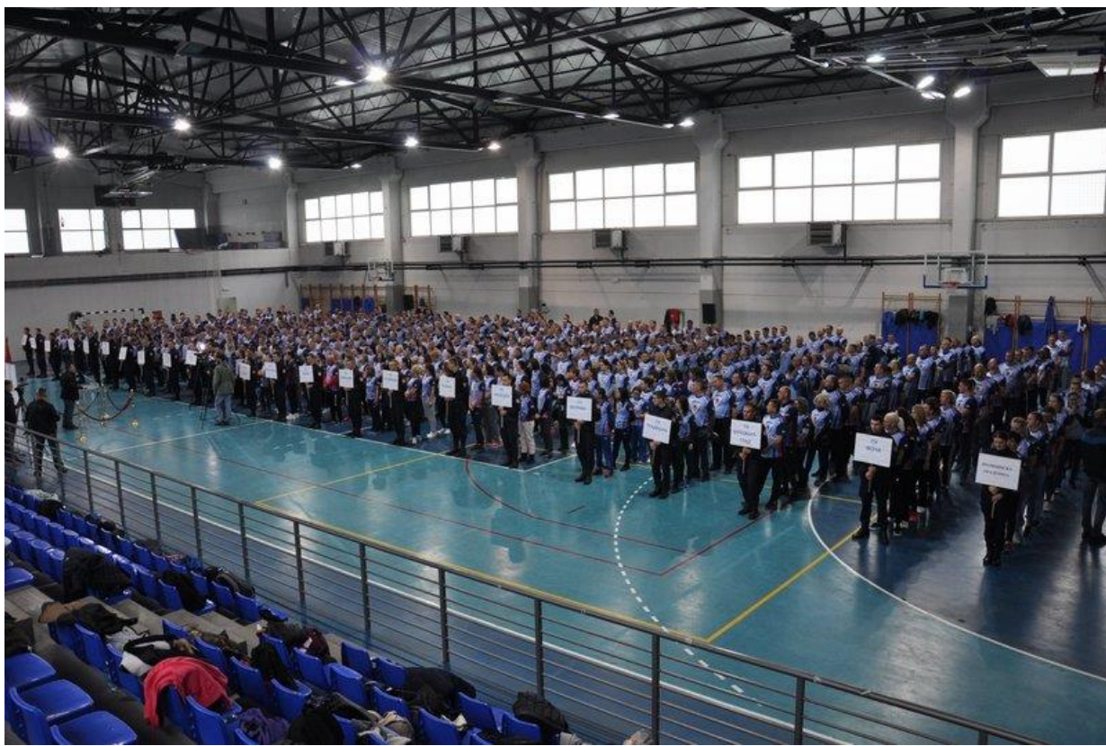
Екипе учеснице постројене за отварање полицијаде