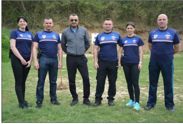
Управа за борбу против тероризма и екстремизма