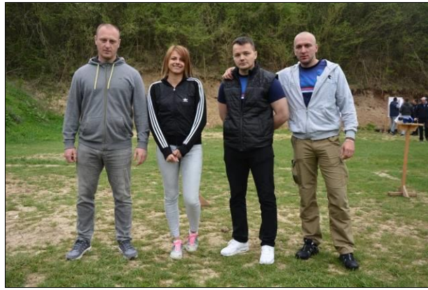
ПУ Источно Сарајево