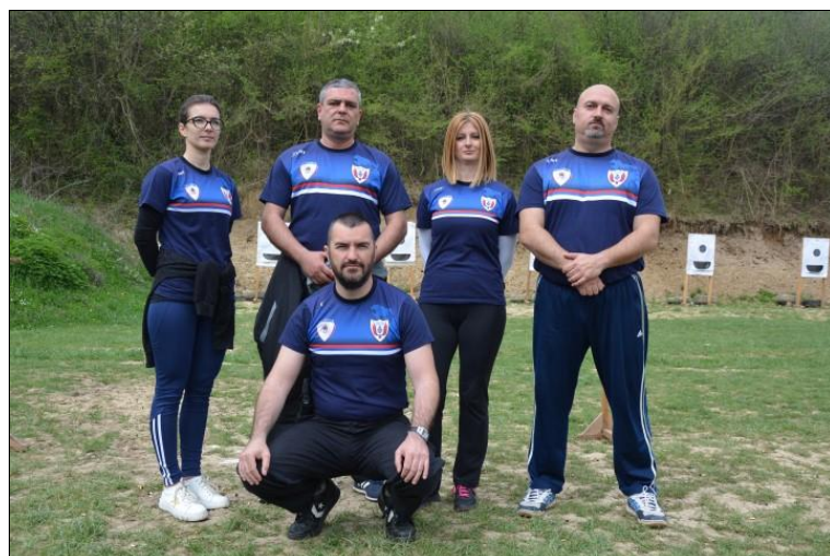
Управа криминалистичке полиције