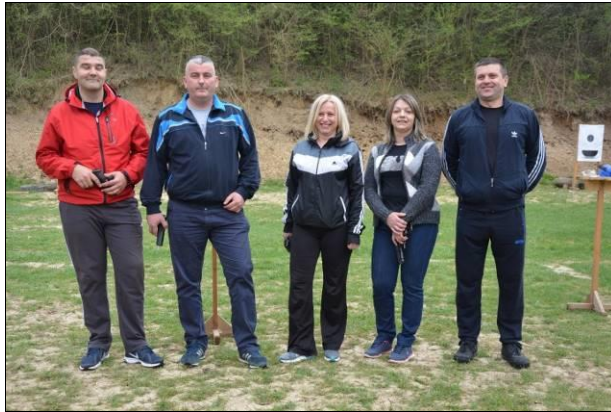
ПУ Мркоњић Град