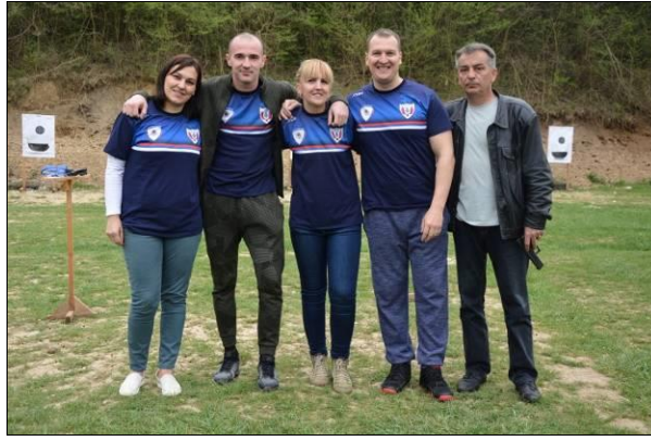
ПУ Бања Лука