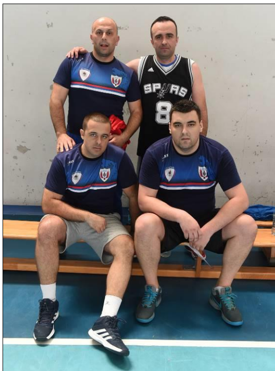
4. мјесто: ПУ Бијељина