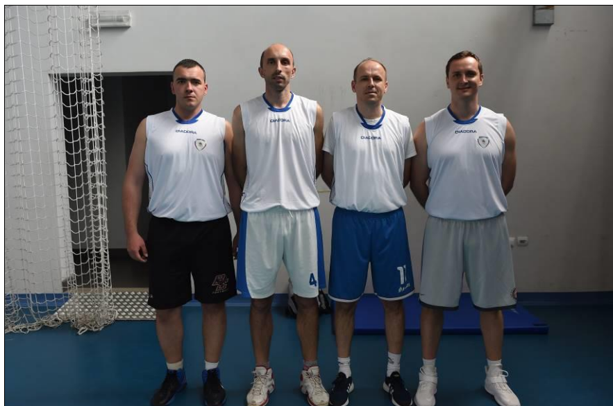
1. мјесто: ПУ Зворник