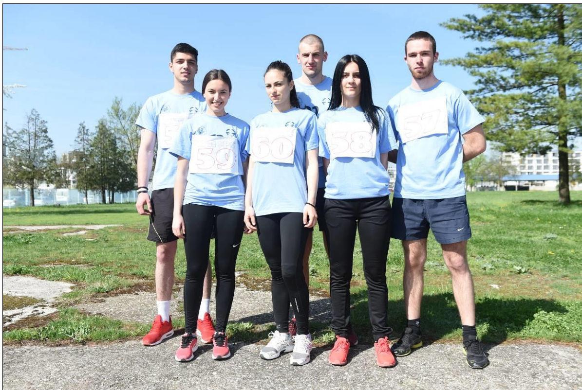
4. мјесто Екипно м/ж: ФБН