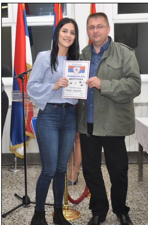
Диплома за најмлађег учесника