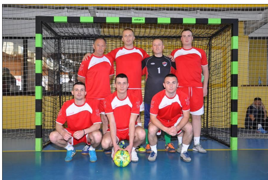
Управа за полицијску обуку