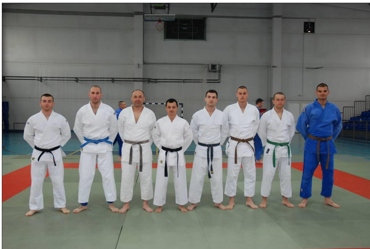
2. мјесто: САЈ: