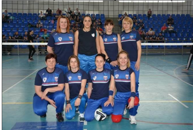
2. мјесто: ПУ Бијељина