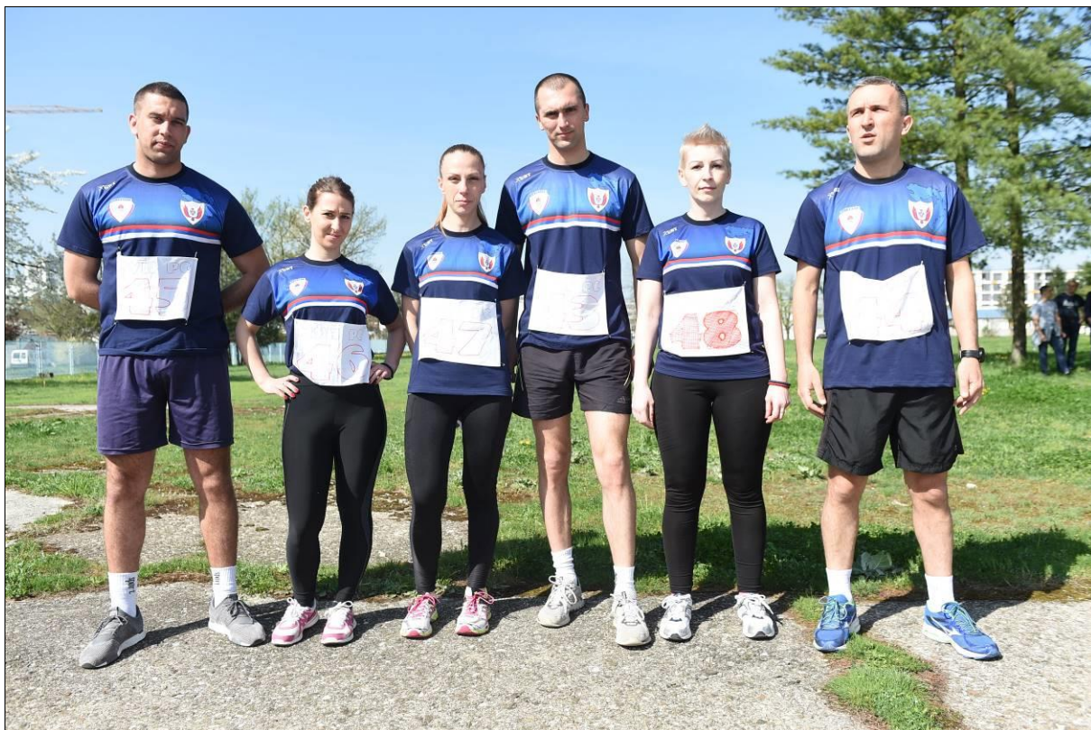
ПУ БАЊА ЛУКА