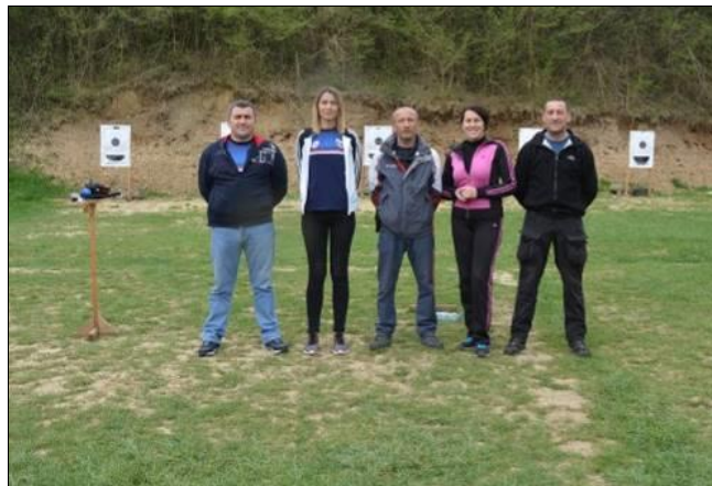
Центар за обуку