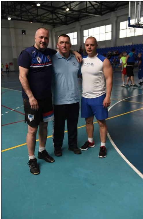
Центар за обуку