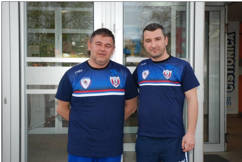
Управа за полицијску подршку