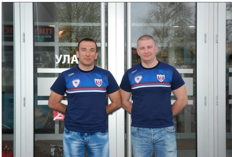
ПУ Источно Сарајево