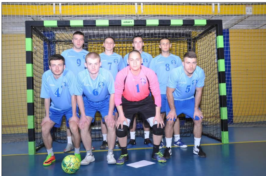
Факултет безбједносних наука