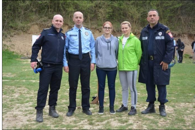
Управа за полицијску обуку