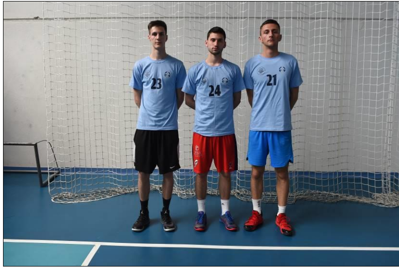
Факултет безбједносних наука