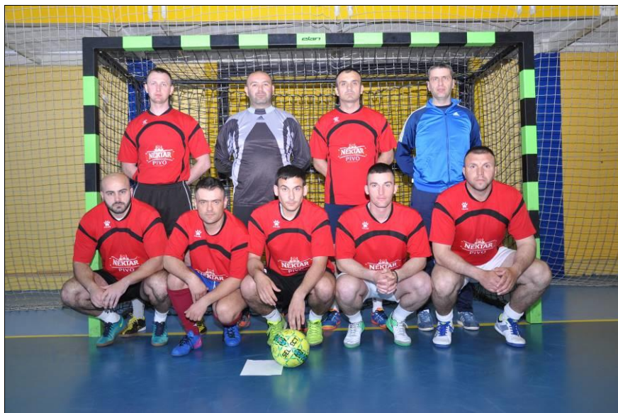
4. мјесто: ПУ Приједор