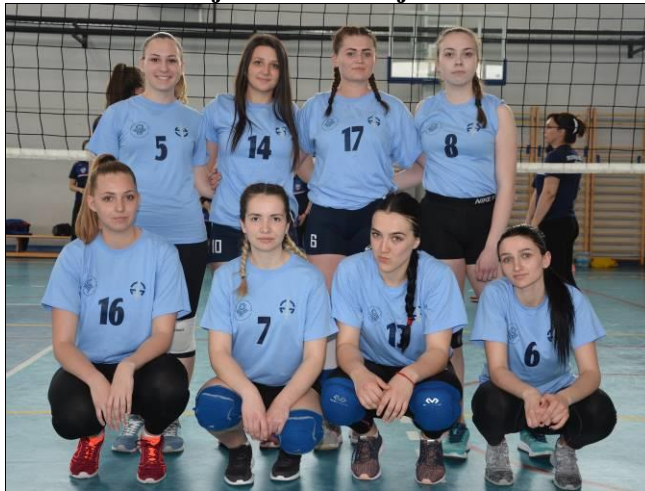
3. мјесто: Факултет безбједносних наука