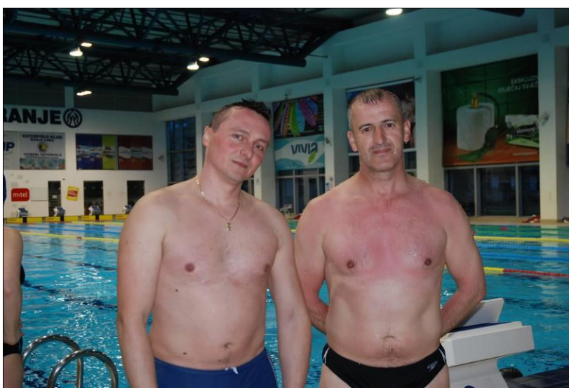
ПУ Мркоњић Град