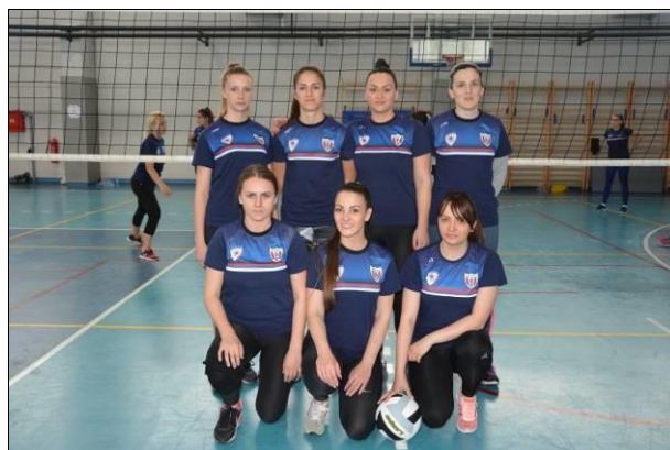
ПУ Бања Лука