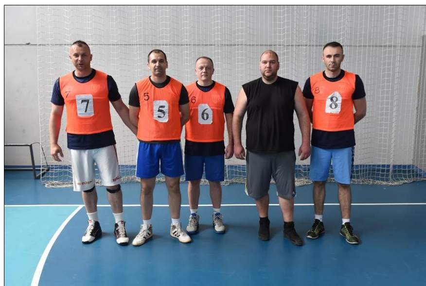
2. мјесто: ПУ Бања Лука