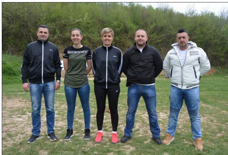
4. мјесто: ПУ Требиње