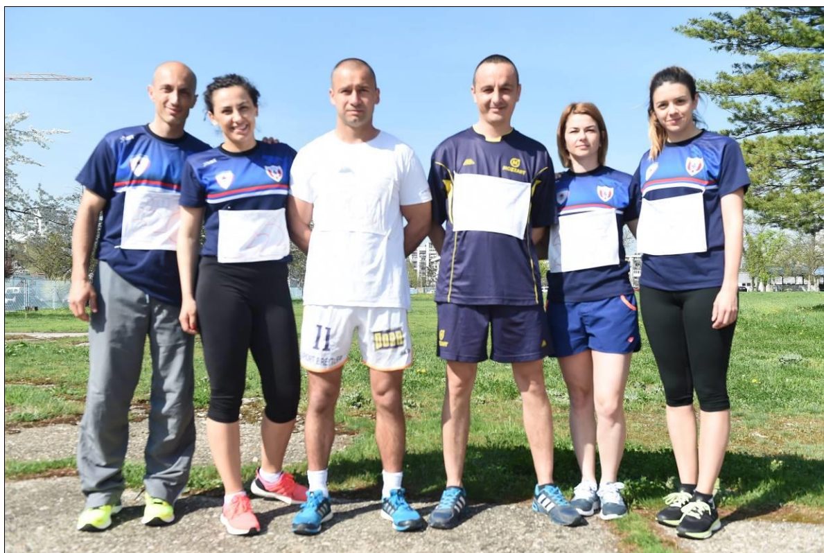
3. мјесто Екипно м/ж: ПУ БИЈЕЉИНА