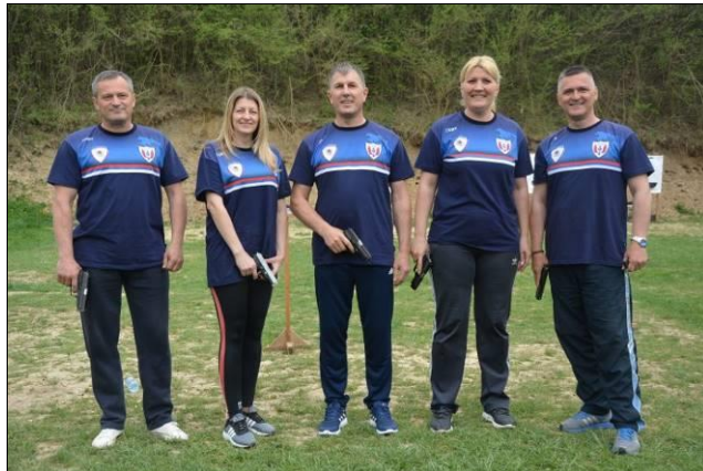
Управа за полицијску подршку