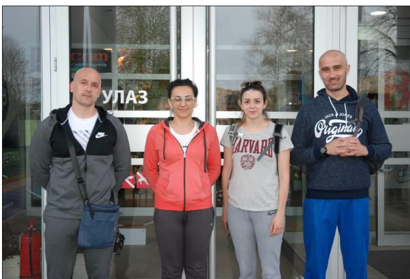
3. мјесто: Управа за правне и кадровске послове