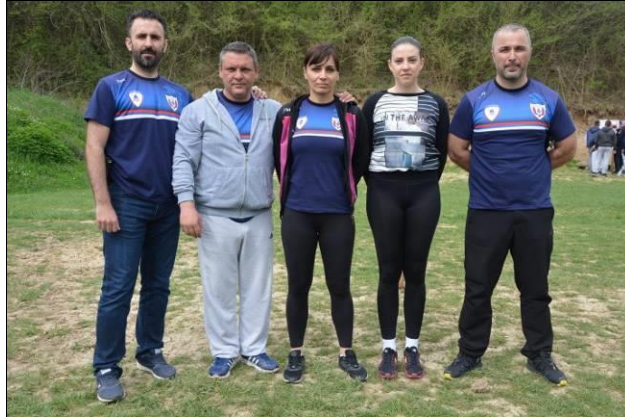
Управа за организовани и тешки криминалитет