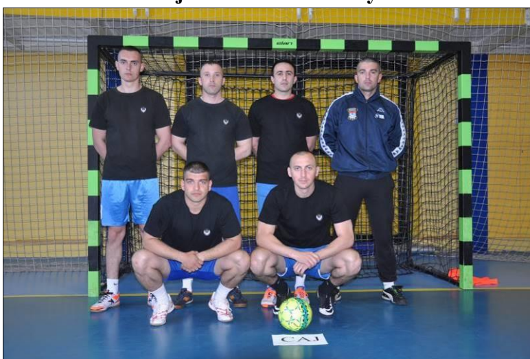
2. место: САЈ