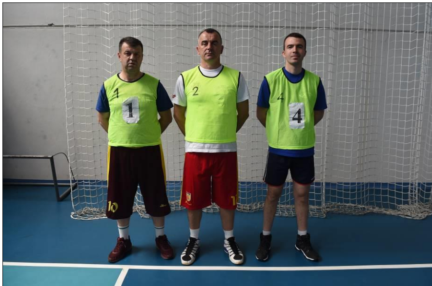
ПУ Мркоњић Град