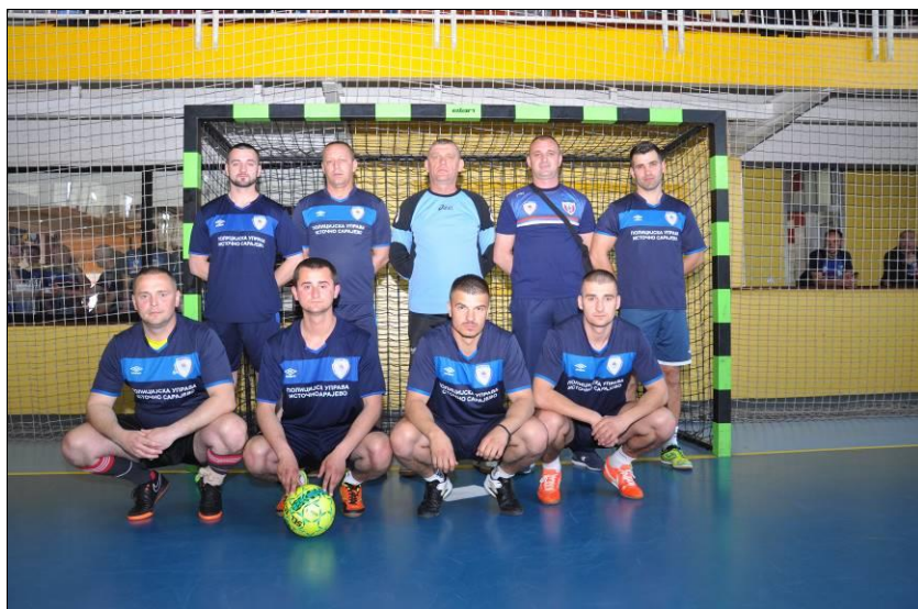
ПУ Источно Сарајево