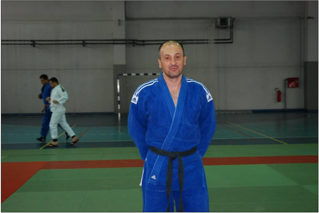
Центар за обуку