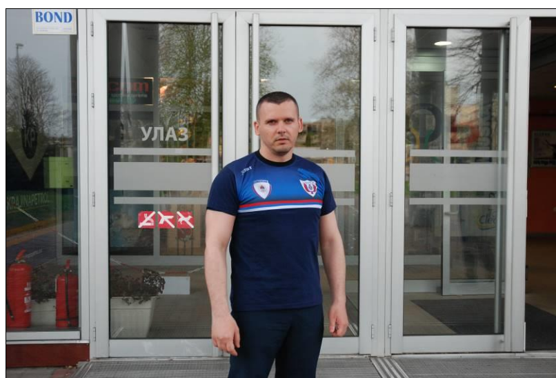
Управа за борбу против тероризма и екстремизма