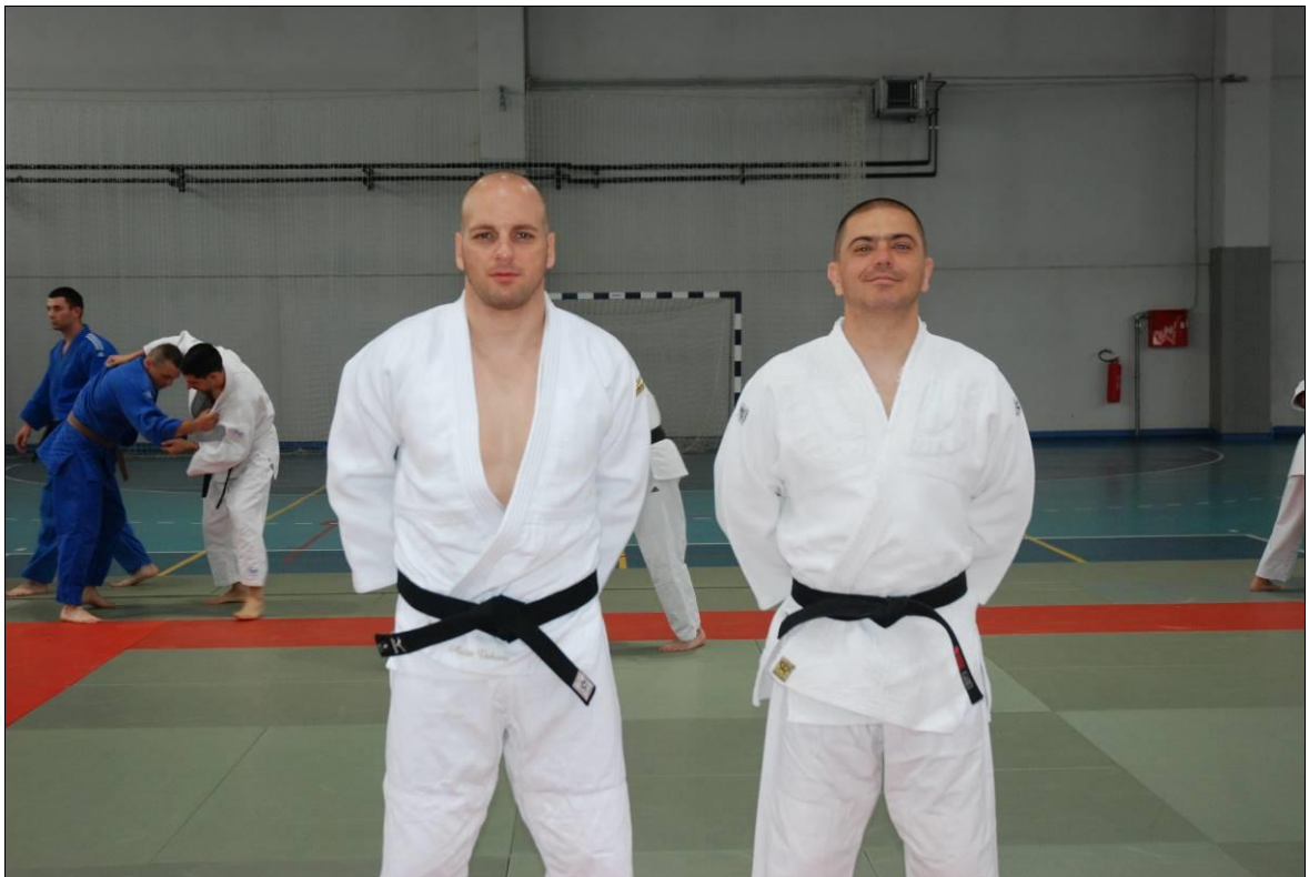
4. мјесто: Управа за полицијску обуку