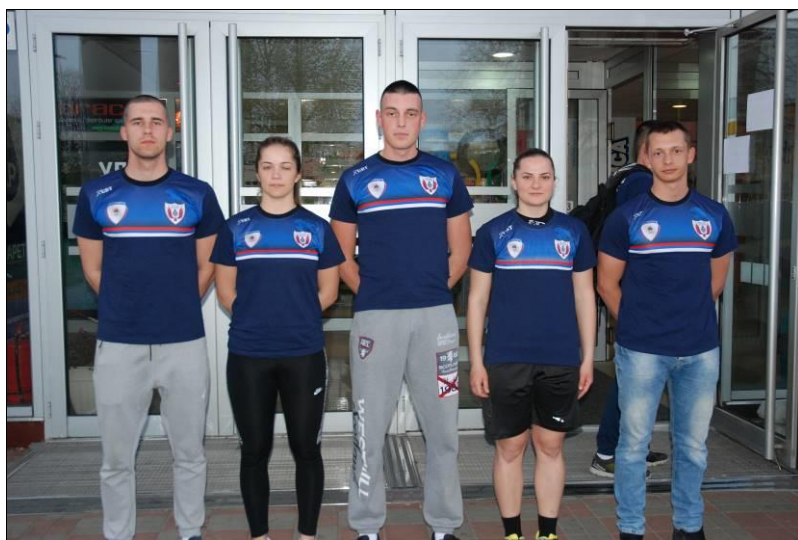
2. мјесто: Полицијска академија