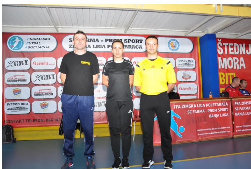
Судије на такмичењу