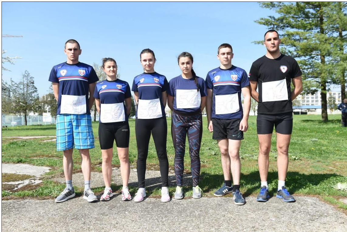
2. мјесто Екипно м/ж: ПА