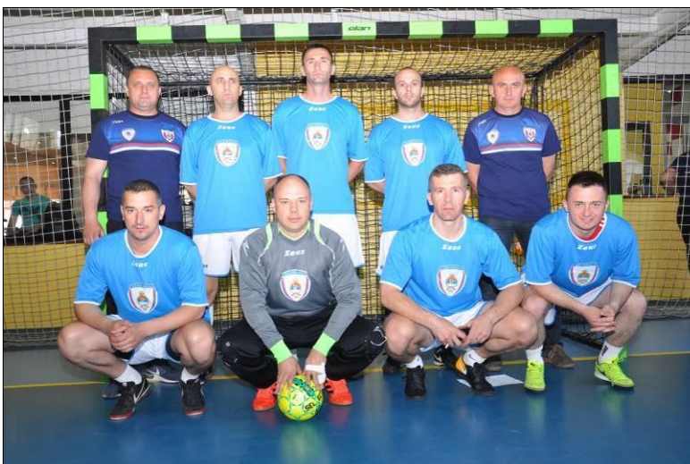
3. мјесто: ПУ Добој