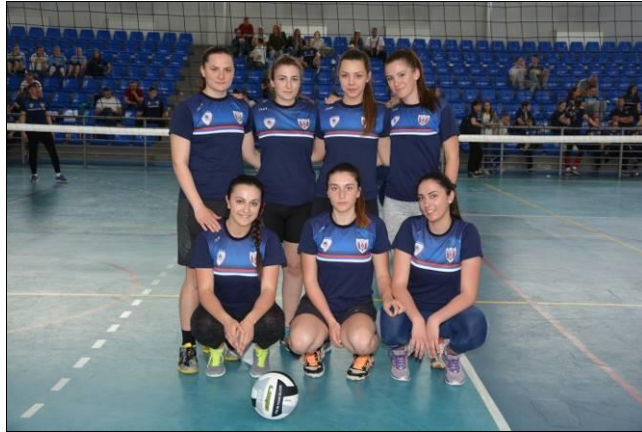
1. мјесто: Полицијска академија