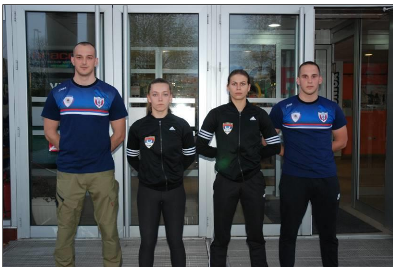
1. мјесто: САЈ