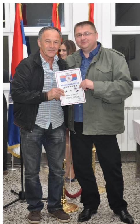
Диплома за најстаријег учесника

Све детаље са додјеле диплома као и остале детаље са полицијаде 2018 моћи ћете видјети на сајту Управе за полицијску обуку на главном изборнику ГАПЕРИЈА.