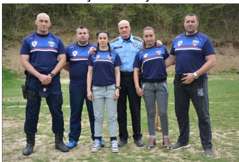
3. мјесто: Управа за ОБЛО