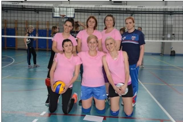
4. мјесто: ПУ Фоча