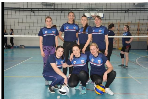
Управа за ОБЛО