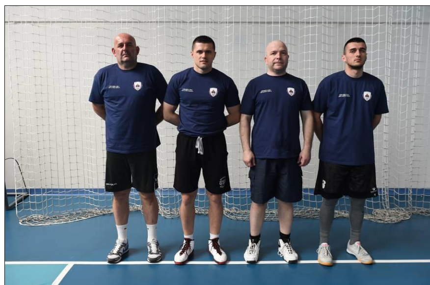
3. мјесто: ПУ Приједор