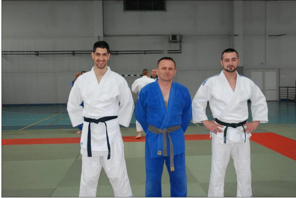
ПУ Источно Сарајево