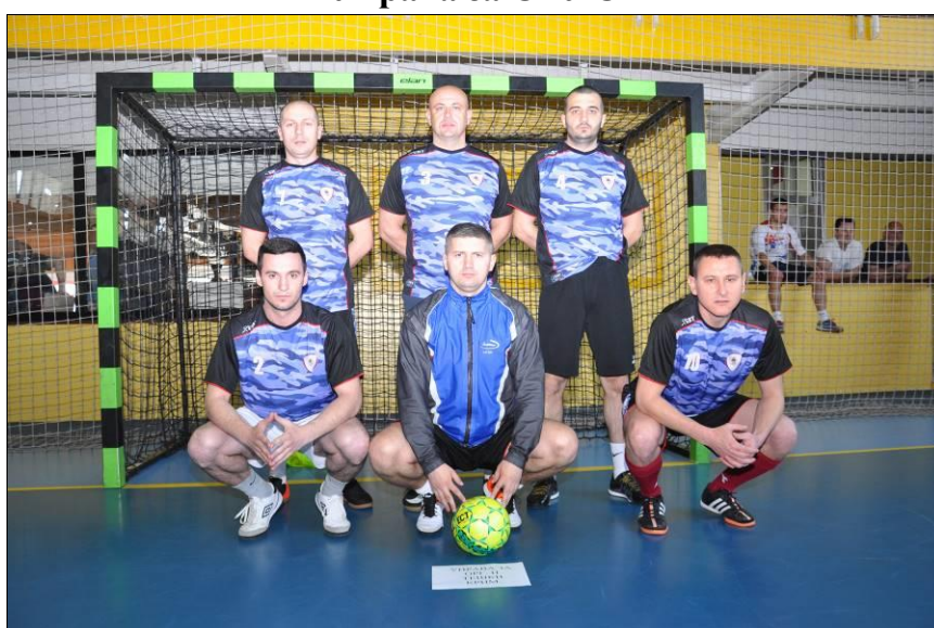
Управа за организовани и тешки криминал