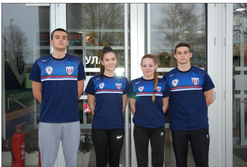
Факултет безбједносних наука