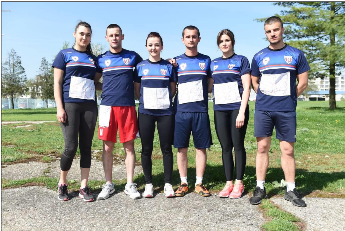
ПУ ИСТОЧНО САРАЈЕВО