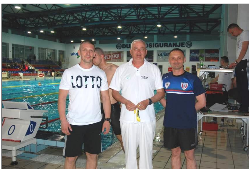
Судије и координатори пливања