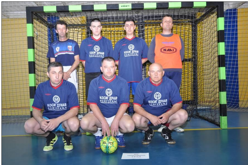
ПУ Мркоњић Град