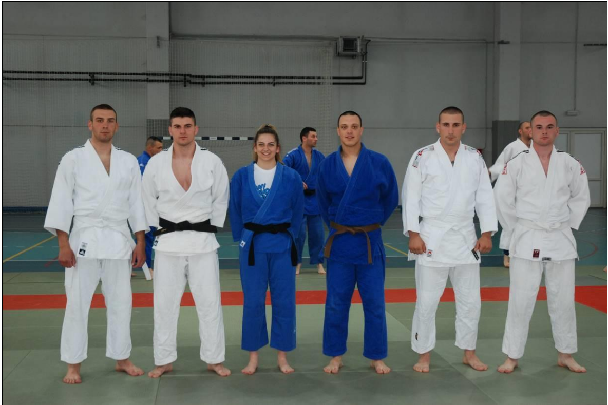
3. мјесто: Полицијска академија