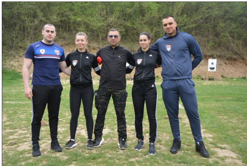
1. мјесто: САЈ