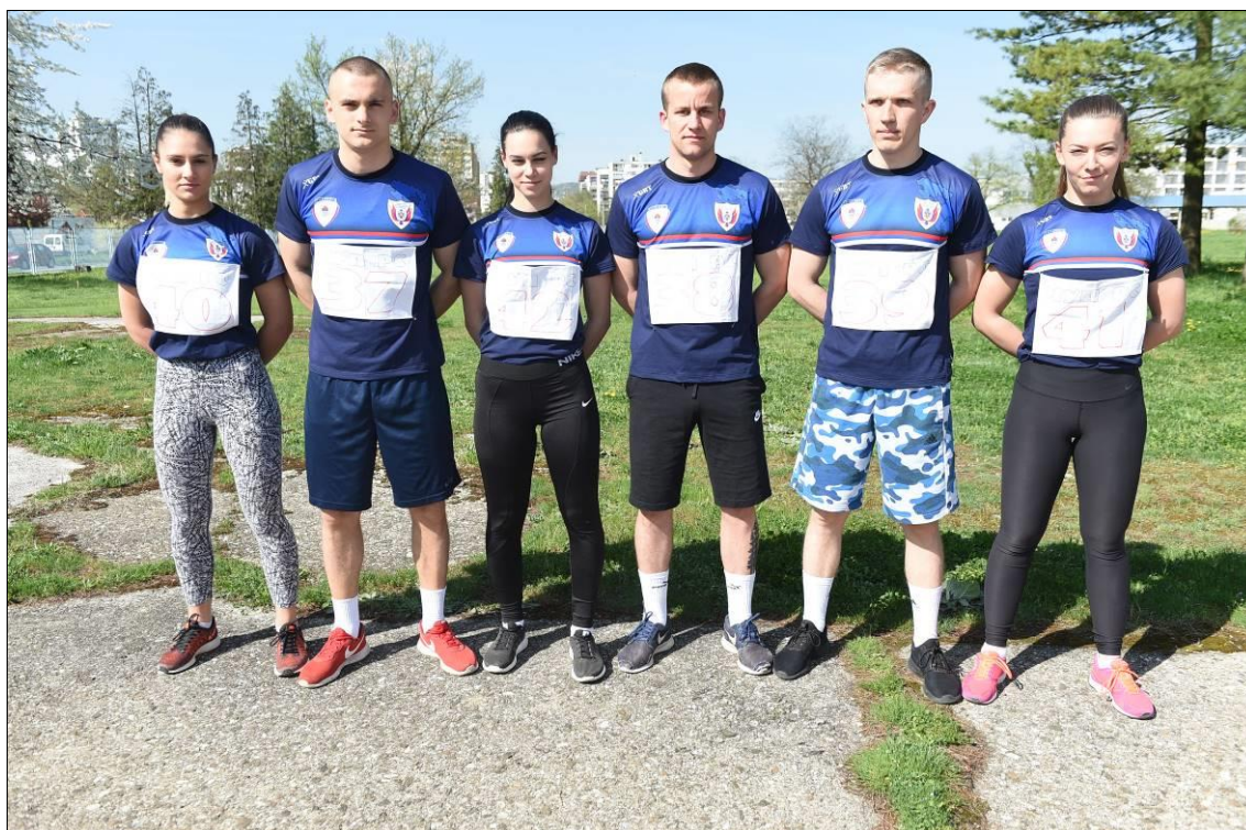
1. мјесто Екипно м/ж: САЈ