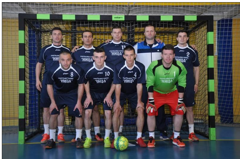
1. мјесто: ПУ Бања Лука