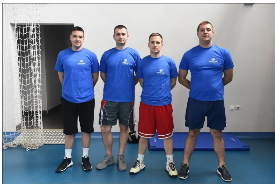
ПУ Источно Сарајево