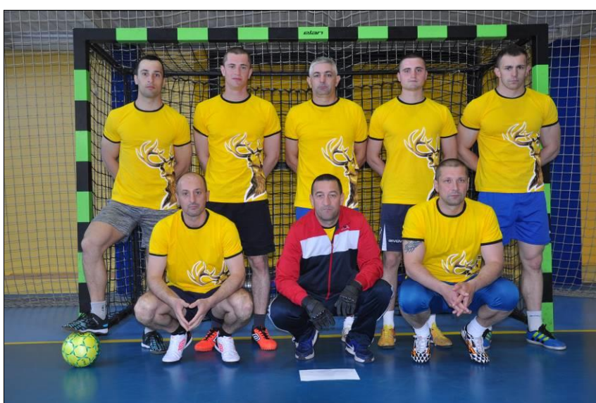
Центар за обуку