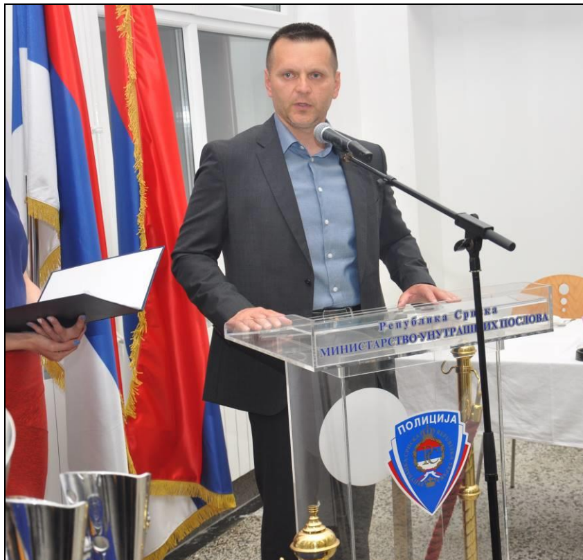
Министар Драган Лукач: обраћање учесницима Полицијаде 2018 на додјели диплома и пехара