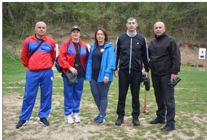
2. мјесто: ПУ Бијељина