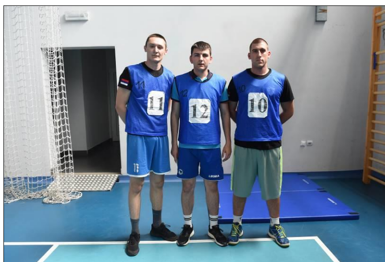
Управа за полицијску обуку