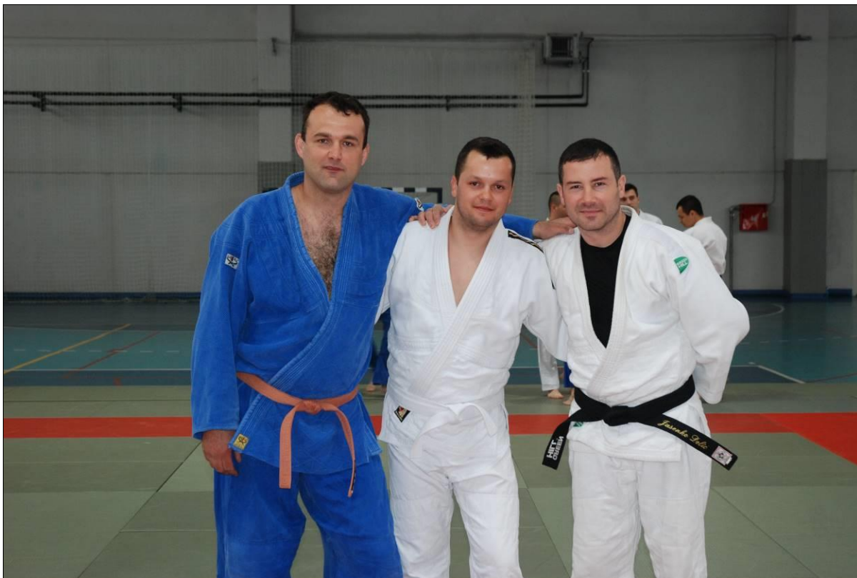
1. Мјесто: ПУ Бања Лука