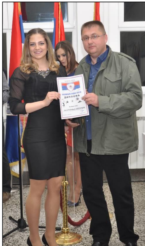
Диплома за фер-плеј