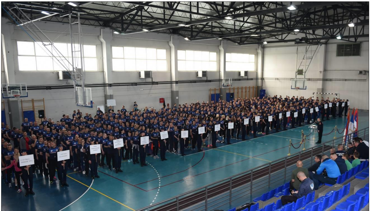
Екипе учеснице на отварању полицијаде