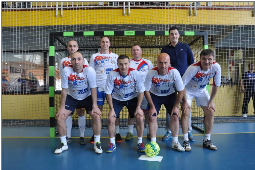
Управа за ОБЛО