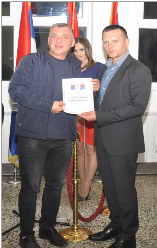
Захвалница за Фарма Пром Бања Лука