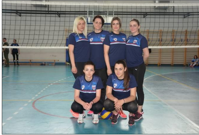
ПУ Источно Сарајево