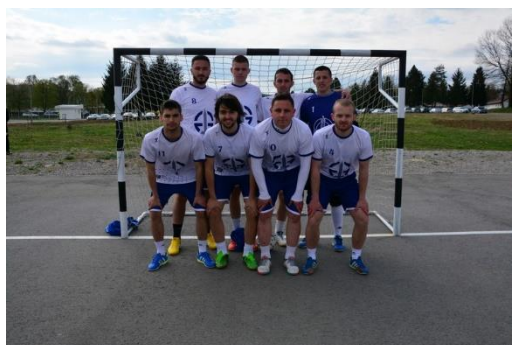
ФБН БАЊА ЛУКА