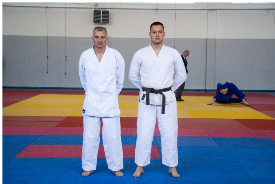
4. ПУ Зворник – (дио екипе),