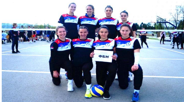
1. мјесто: Факултет безбједносних наука