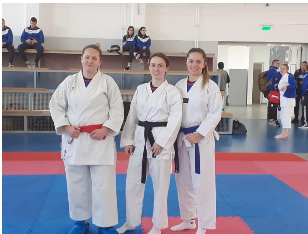
2. мјесто ПУ Бијељина