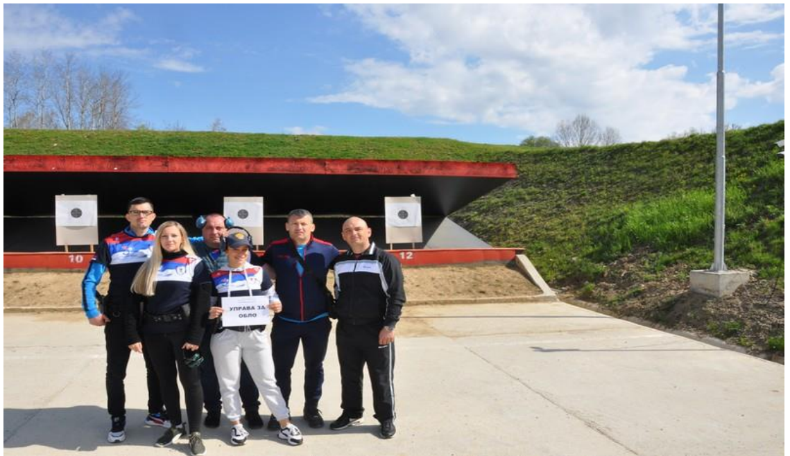
1. мјесто – Управа за ОБЛО