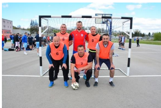
СЛУЖБА МИНИСТРА – УПО