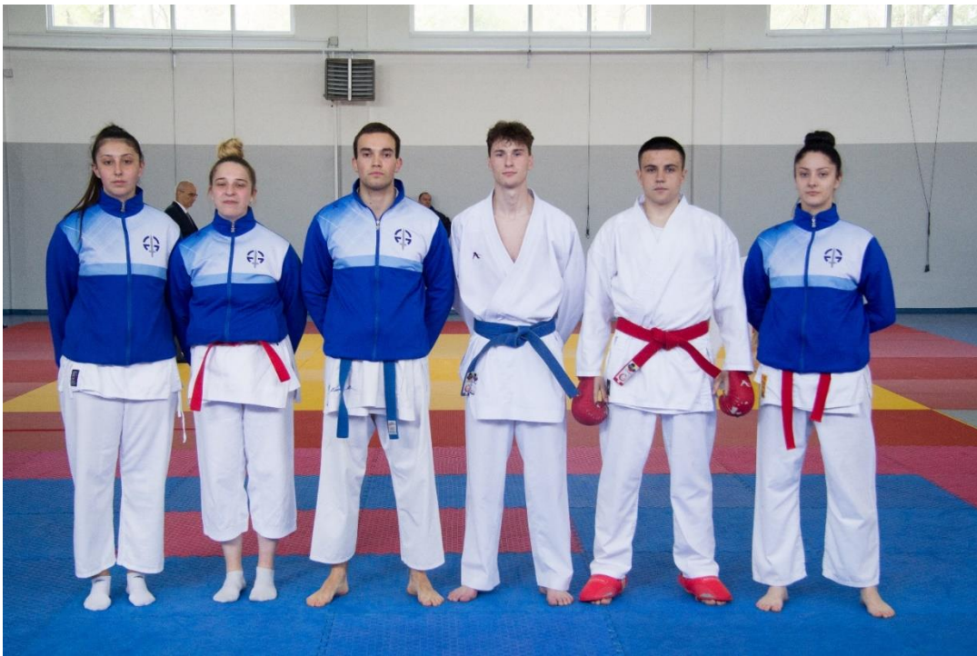
9. Факултет безбједносних наука