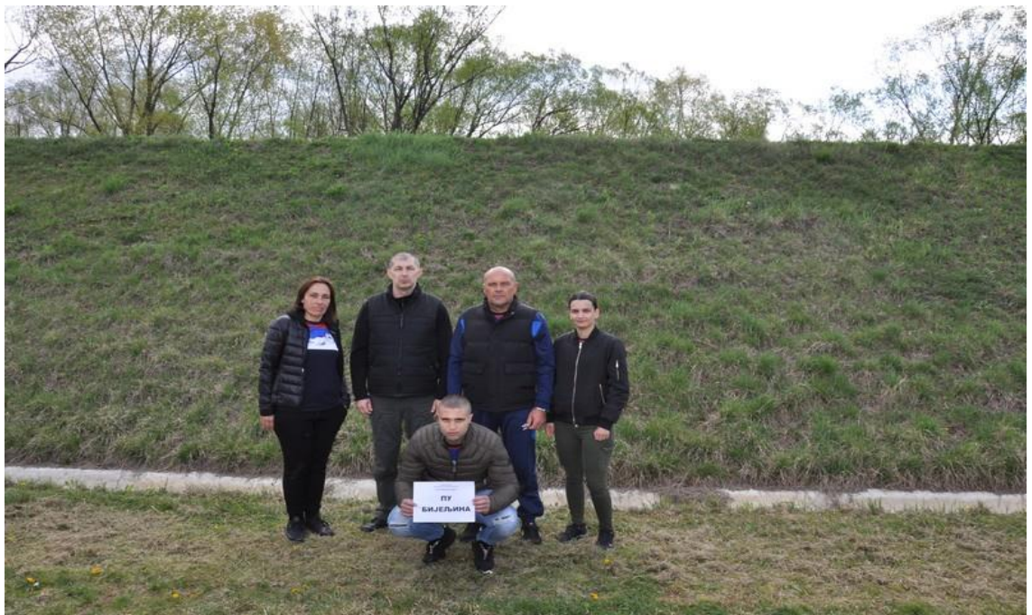
2. мјесто – ПУ Бијељина