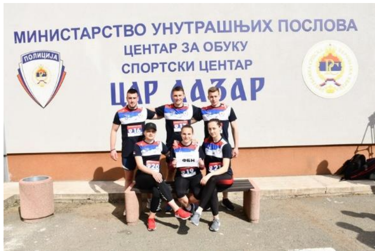
2. мјесто: ФБН