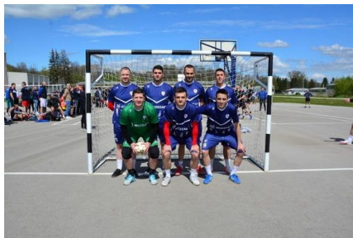
ПУ БАЊА ЛУКА