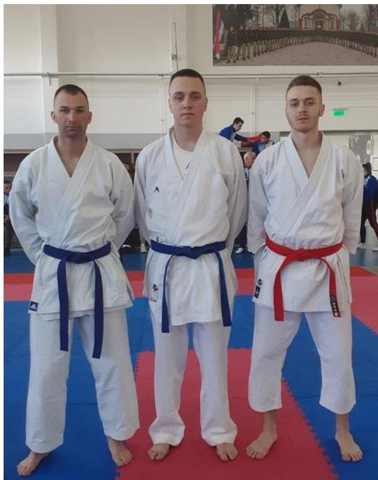
3. мјесто ПУ Бијељина