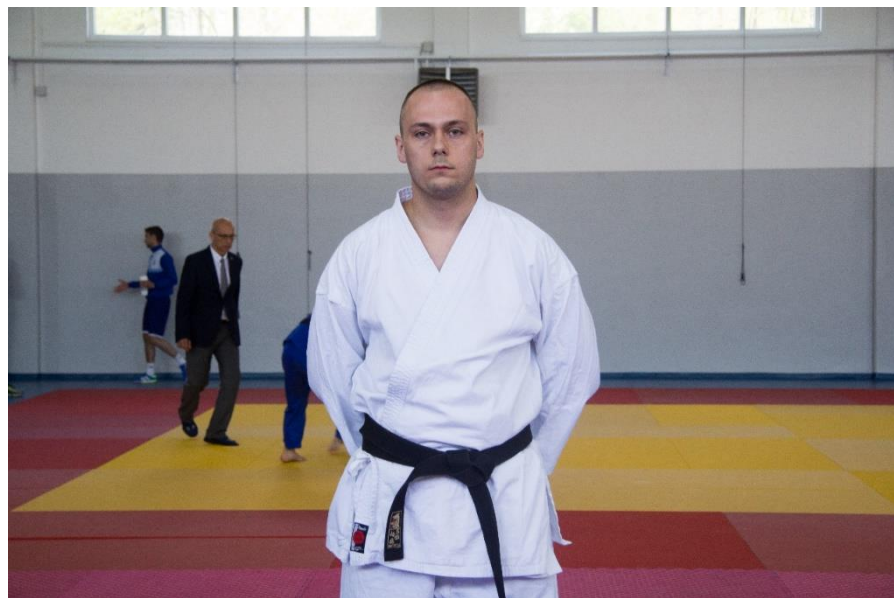
3. ПУ Добој