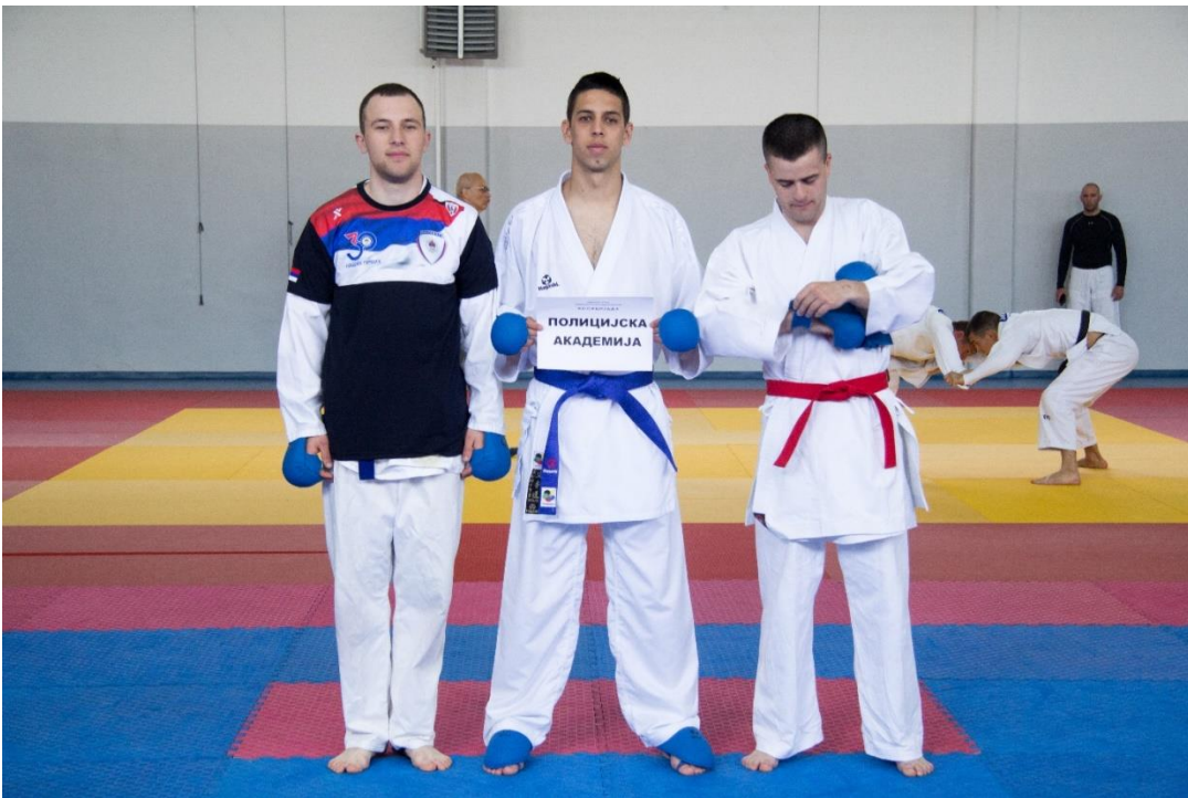
10. Полицијска академија