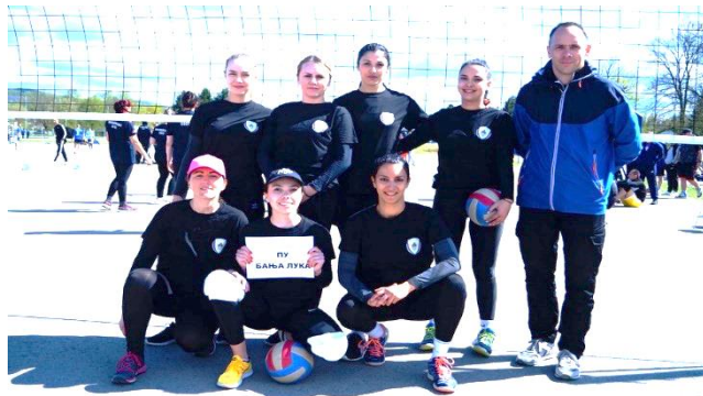
3. мјесто: ПУ Бања Лука