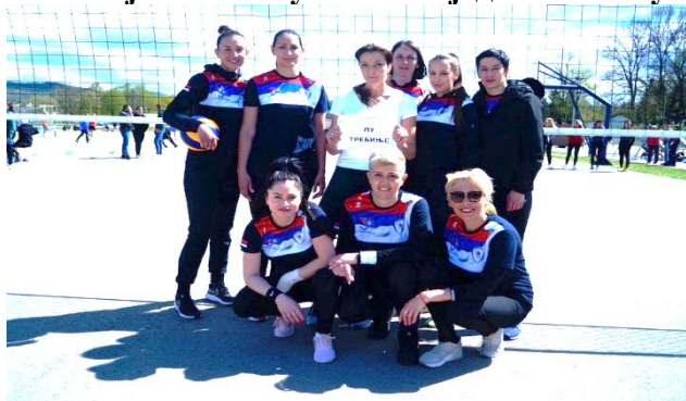
2. мјесто: ПУ Требиње