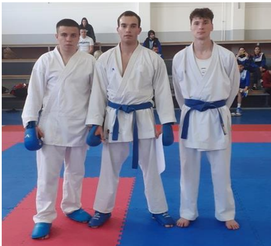
2. мјесто ФБН