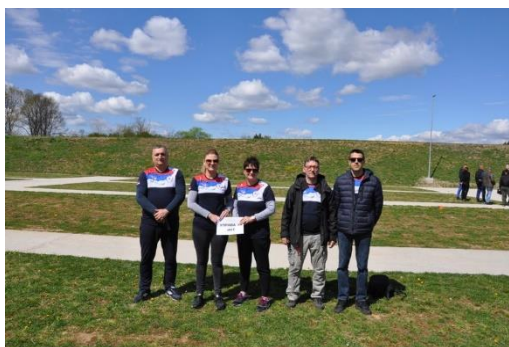
УПРАВА ЗА ИКТ