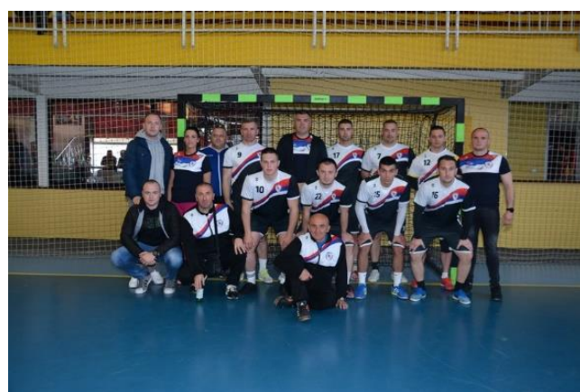
2. мјесто ПУ ДОБОЈ