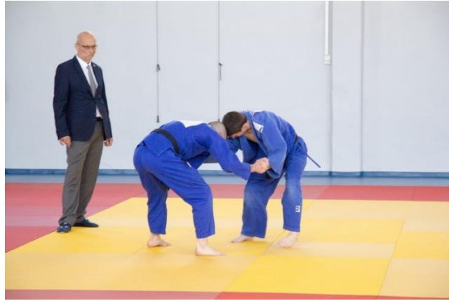
Савезни судија Зоран Ћуп