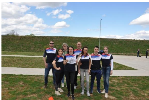
УПРАВА ЗА ПРАВНЕ И КАДРОВСКЕ ПОСЛОВЕ