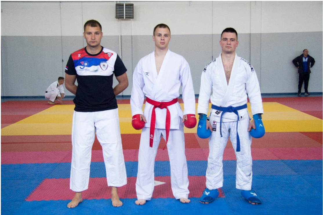
7. Управа полције, Јединица жандрармерије