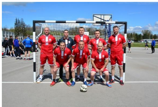
ПУ МРКОЊИЋ ГРАД