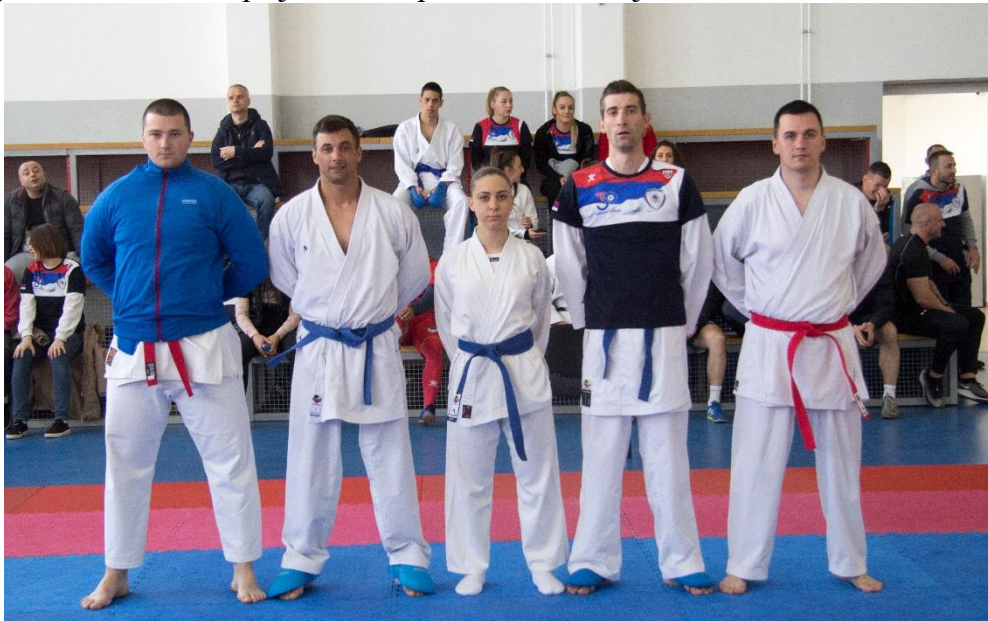
1. ПУ Бања Лука