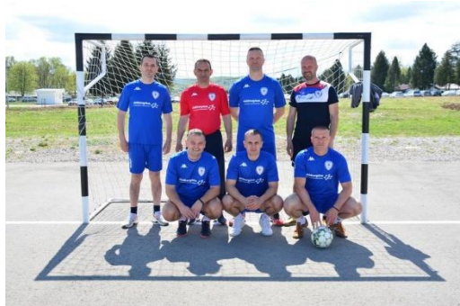
УПРАВА ЗА ПОЛИЦИЈСКУ ПОДРШКУ