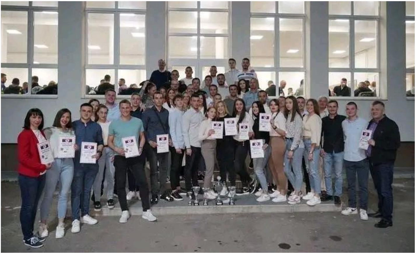
ФАКУЛТЕТ БЕЗБЈЕДНОСНИХ НАУКА – свеукупни побједник Полицијаде 2022