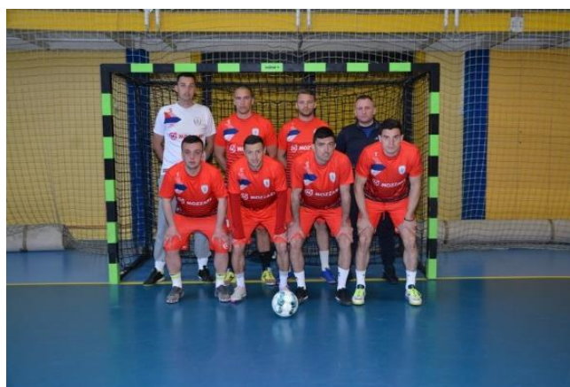
1. мјесто УПРАВА ЗА ОБЛО