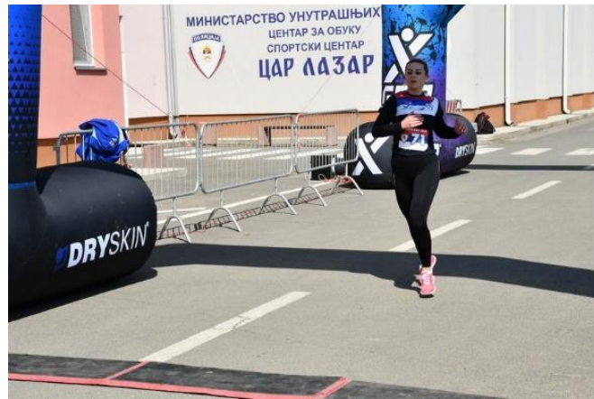
1. мјесто: ШОРМАЗ МАРИНА - ПУ ПРИЈЕДОР