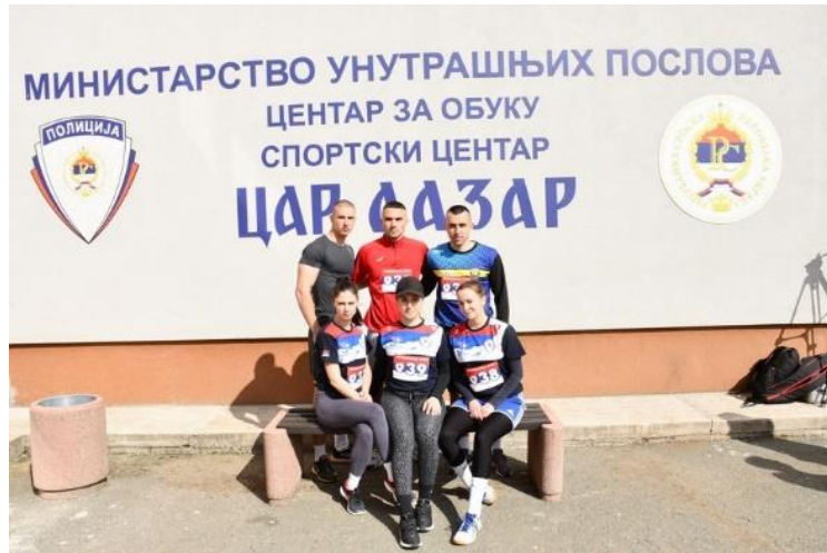
1. мјесто: ПА