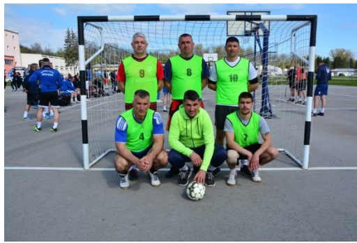
ЦЕНТАР ЗА ОБУКУ