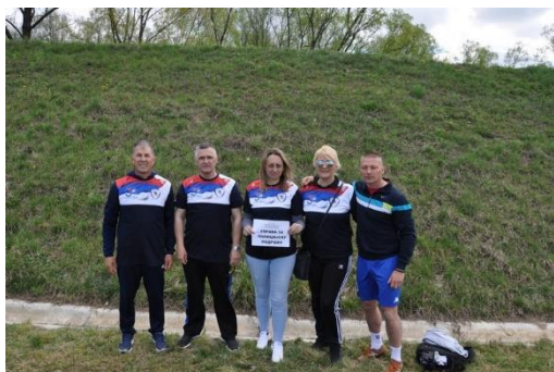
УПРАВА ЗА ПОЛИЦИЈСКУ ПОДРШКУ