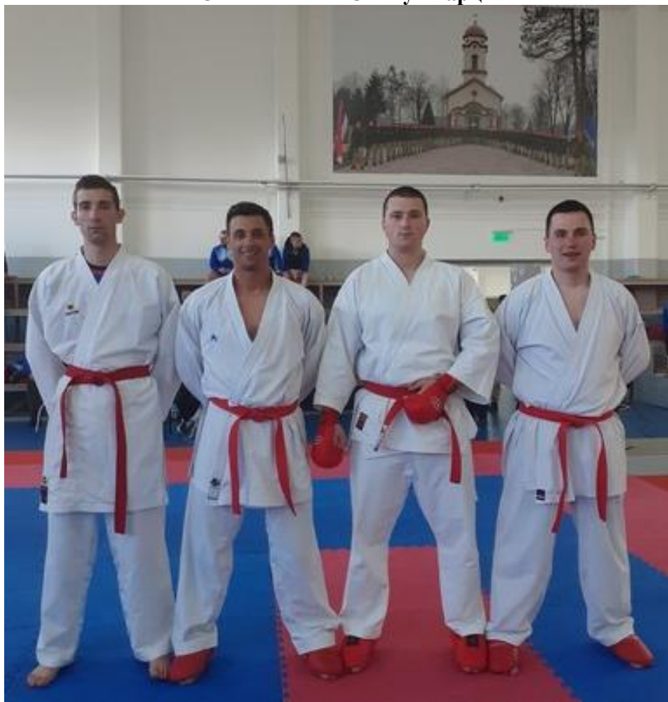
1. мјесто ПУ Бања Лука