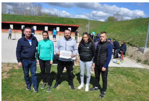
УПРАВА ЗА БОРБУ ПРОТИВ ТЕР. И ЕКСТР.