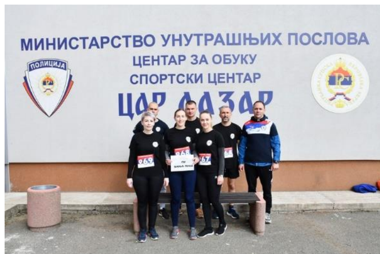
3. мјесто: ПУ БАЊА ЛУКА