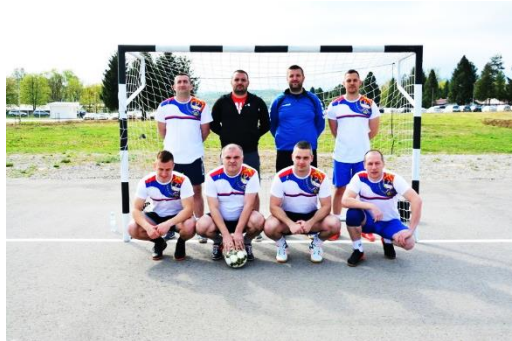
УПРАВА ЗА БОРБУ ПРОТИВ ТЕР. И ЕКС.