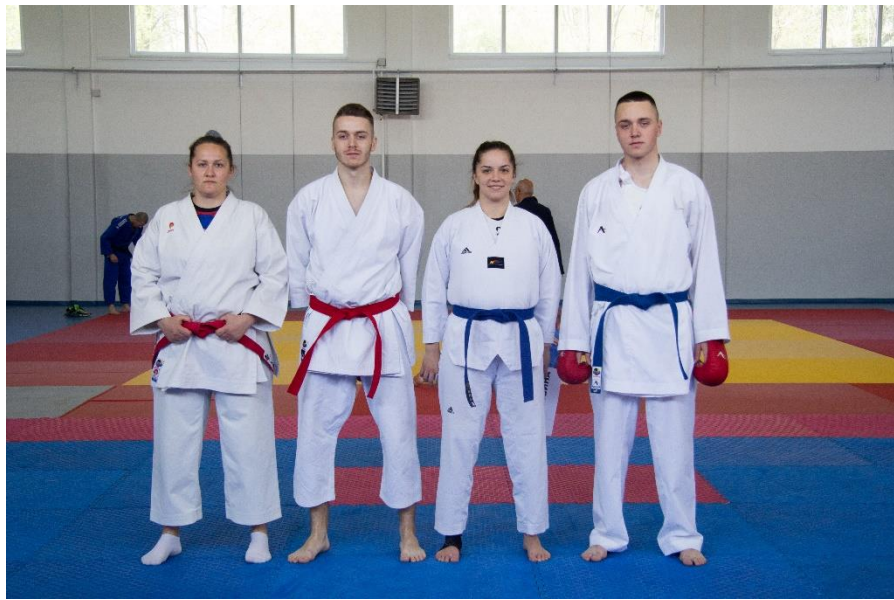
2. ПУ Бијељина – (дио екипе)