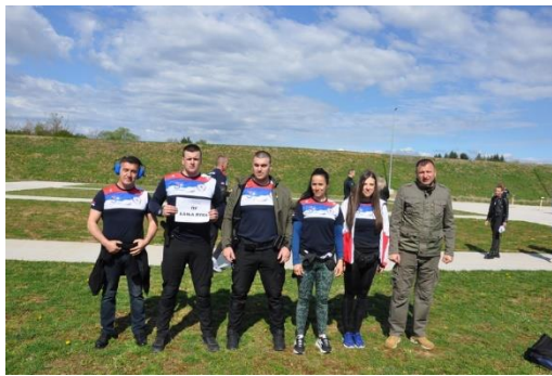
ПУ БАЊА ЛУКА