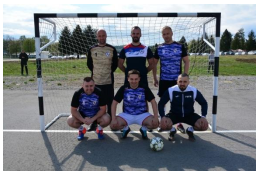
УПРАВА ЗА ОРГ. И ТЕШКИ КРИМ.