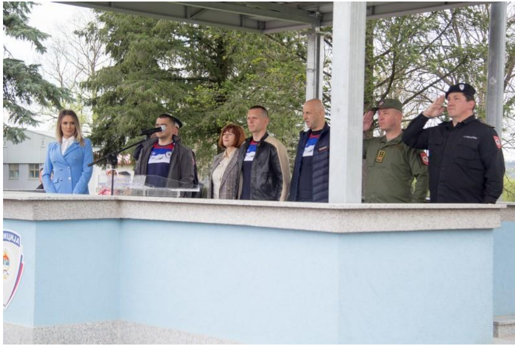
Постројавање екипа и отварање полицијаве