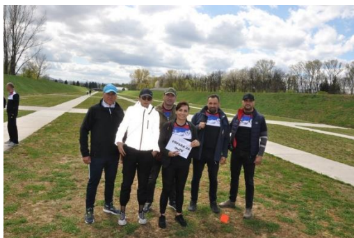
УПРАВА ЗА ОИТК