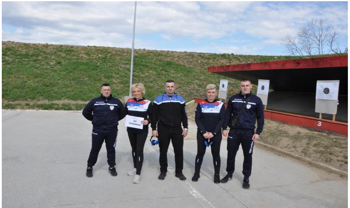
4. мјесто – ПУ Требиње