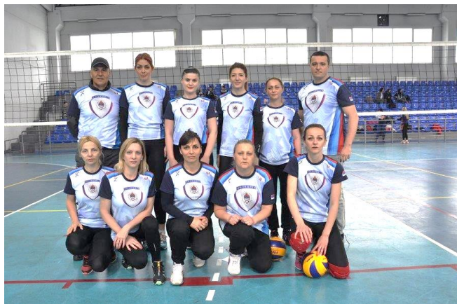
4. мјесто: Управа за ОБЛО