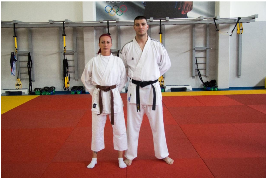
8. Управа за обезбјеђење личности и објеката