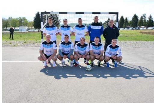
ПУ ИСТОЧНО САРАЈЕВО