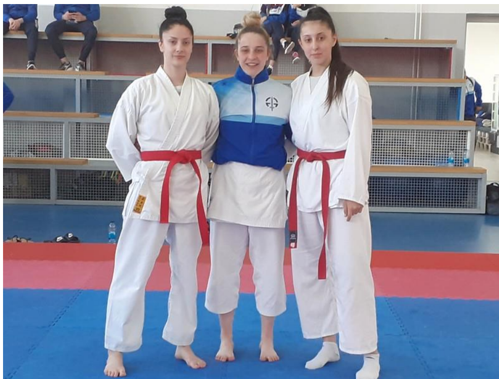
1. мјесто ФБН