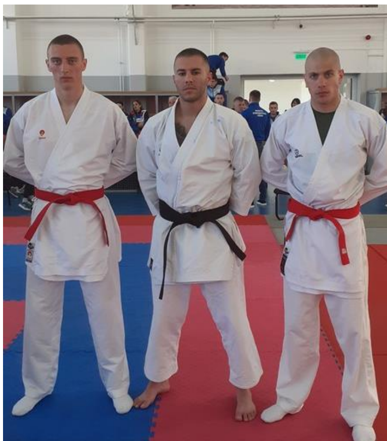
3. мјесто 4 САЈ