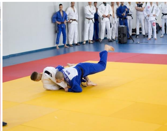
Слике из борби