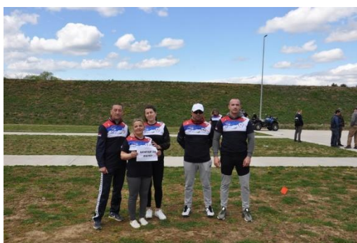
ЦЕНТАР ЗА ОБУКУ