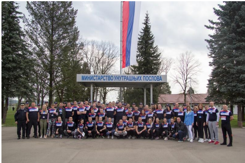
Такмичари Управе за полицијску обуку и Полицијске академије