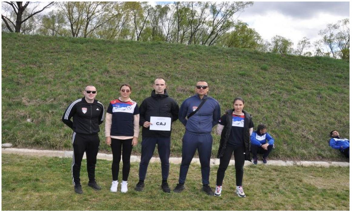
3. мјесто – CAJ