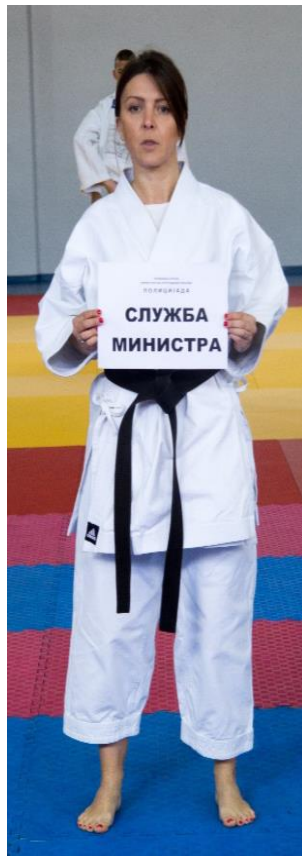
5. Служба министра