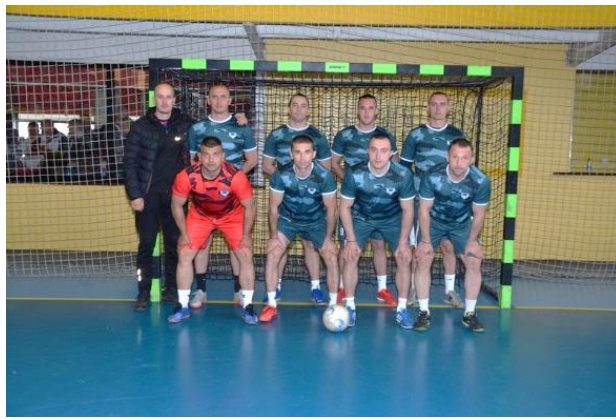
3. мјесто САЈ