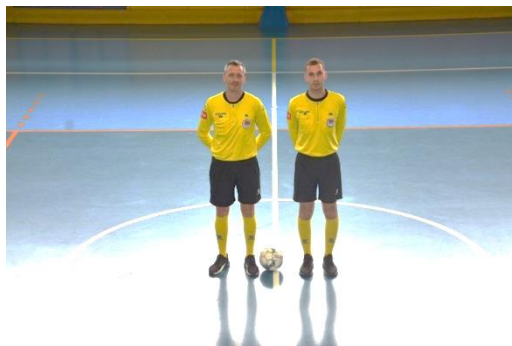
Судије у малом фудбалу